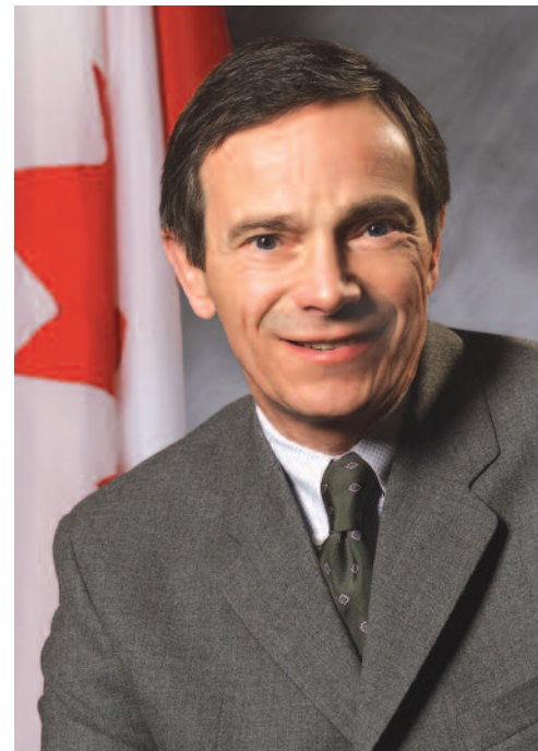
L'honorable Stephen Owen Ministre de la Diversification de l'économie de l'Ouest canadien et ministre d'État (Sport)

Notre vision de l'avenir repose sur l'édification de collectivités plus durables. Cela va au-delà des infrastructures de base pour combiner des facteurs économiques, sociaux, culturels et environnementaux afin d'offrir des avantages plus larges et plus durables aux résidents et à leurs collectivités. Le Canada – particulièrement l'Ouest du pays – est rapidement en train de devenir un chef de file mondial dans le domaine du développement durable, et deux événements de premier plan attireront bientôt l'attention du monde entier sur les compétences de notre pays dans ce domaine.