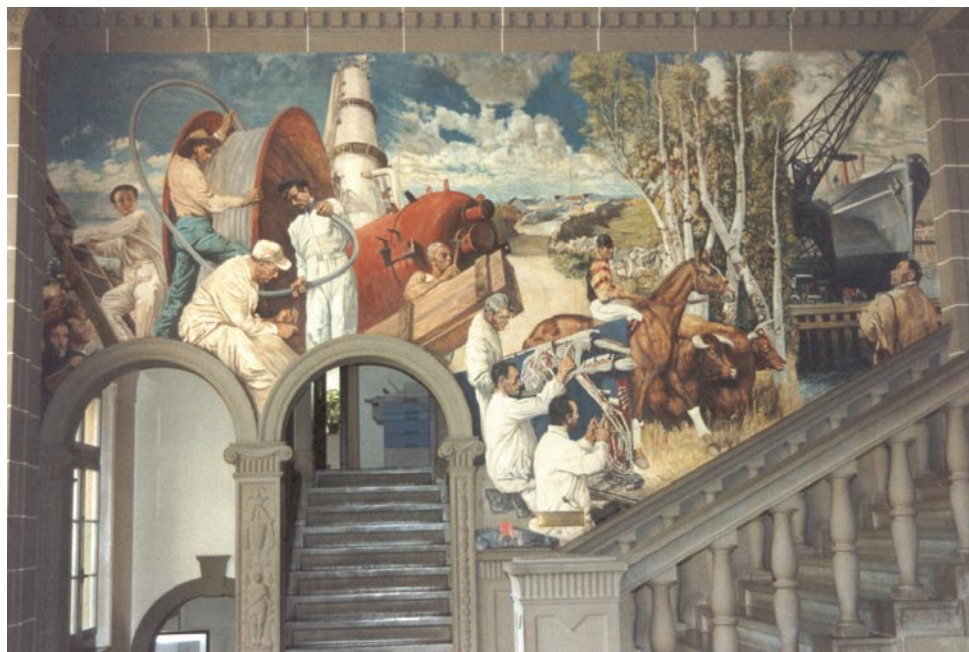
Fresque murale de l'artiste Sean Keating

Sur la paroi ouest, l'artiste irlandais Sean Keating a poursuivi sur le thème du travail dans sa dimension universelle.