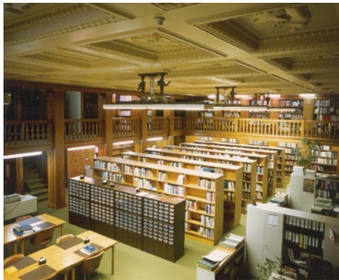
Bibliothèque de l'OMC

À la droite de cette fresque, se trouve la Bibliothèque de l'OMC, que décorent de précieuses boiseries et qui renferme une collection unique d'ouvrages sur le système commercial multilatéral.