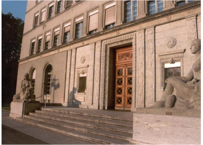
Des représentations de La Paix (à droite) et de La Justice encadrent l'entrée principale du bâtiment de l'OMC

Les deux statues imposantes disposées de chaque côté de l'entrée principale du Centre William Rappard représentent La Paix (côté droit) et La Justice. Ces deux statues ont été sculptées par l'artiste genevois Luc Jaggi.