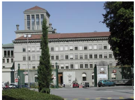
Entrée du Centre William Rappard

Le bâtiment a successivement accueilli l'Organisation internationale du travail, le Haut Commissariat des Nations Unies pour les réfugiés, la Bibliothèque de l'Institut universitaire de hautes études internationales et le Secrétariat de l'Accord général sur les tarifs douaniers et le commerce (GATT) qui, avant la création de l'OMC, assumait la responsabilité du système commercial mondial. Depuis 1995, il abrite le siège de l'OMC.