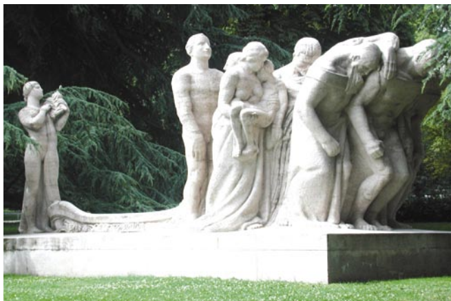
«L'Effort humain», sculpture réalisée par James Vibert, dans le parc William Rappard

La plus grande sculpture, intitulée «L'Effort humain», a été réalisée par l'artiste genevois James Vibert en 1935. Le parc abrite également d'autres œuvres offertes par divers donateurs dont une fontaine ornementale surmontée d'un Neptune géant, une statue délicate, «La jeune fille au piano», ainsi qu'un cheval finement sculpté.