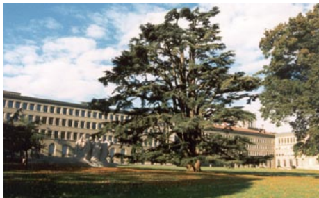
Le parc William Rappard à l'est du Centre William Rappard

Le parc William Rappard, situé entre la Villa Barton et le Jardin Botanique de Genève, offre l'une des vues les plus spectaculaires du lac Léman et, à l'arrière plan, de la chaîne des Alpes.