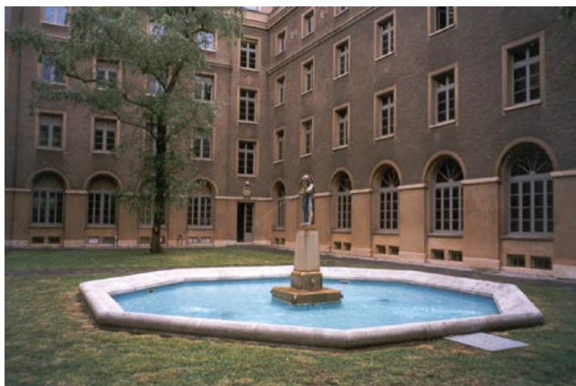
Cour intérieure du Centre William Rappard, de style florentin

En 1923, un concours international d'architecture a été organisé et c'est l'architecte suisse, George Epitoux de Lausanne, qui a été retenu pour dessiner les plans du siège du BIT. Son projet s'inspirait des villas florentines classiques, avec une cour intérieure, une entrée imposante et un vaste escalier partant du hall principal. Les travaux de construction ont débuté en 1923 et le bâtiment a été inauguré le 6 juin 1926.