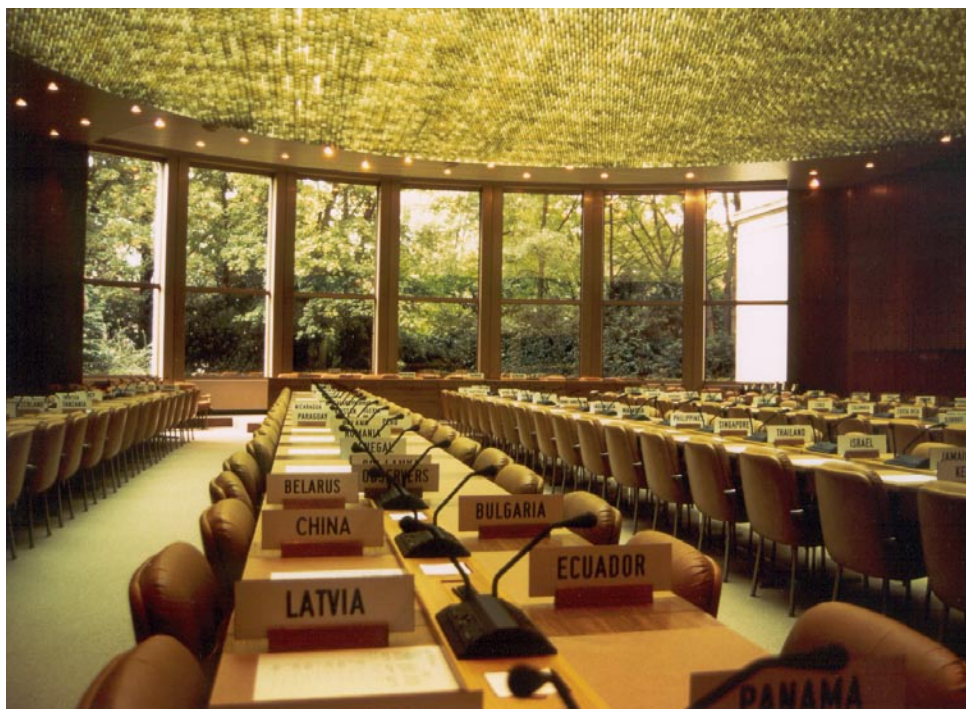
La Salle de réunion Wyndham White, avec indication de la place réservée à chaque Membre de l'OMC

Chaque jour, des diplomates spécialistes des questions commerciales et des fonctionnaires du Secrétariat de l'OMC se retrouvent au CWR pour y discuter de la politique commerciale, négocier des règles et chercher à résoudre des différends liés aux accords commerciaux qui constituent l'ensemble du droit commercial international élaboré depuis 1947. Le Centre compte 21 salles de réunion auxquelles s'ajoute le centre de conférences