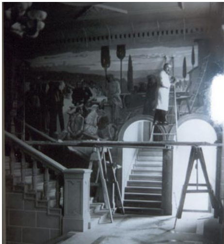
L'artiste Maurice Denis devant sa fresque murale «La dignité du travail»

Un vaste escalier conduit le visiteur du hall principal au palier du premier étage, lequel est décoré de chaque côté de grandes fresques murales représentant le travail sous toutes ses formes. Sur la paroi est, l'artiste français Maurice Denis a peint «La dignité du travail».