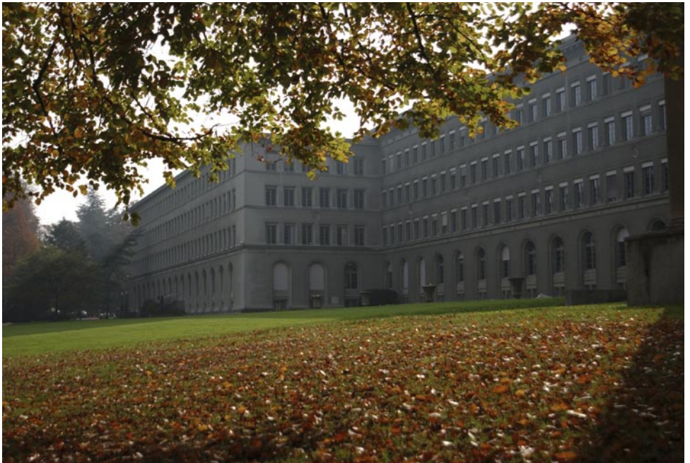
Le Centre William Rappard, qui abrite l'OMC.

L'OMC reçoit chaque année au Centre William Rappard des milliers de visiteurs, dont des étudiants, des ministres et des fonctionnaires gouvernementaux chargés des questions commerciales qui participent aux réunions, des Chefs d'État en visite officielle et des membres du public simplement intéressés par le siège de l'OMC. Nous espérons que tous ceux qui visiteront le bâtiment auront une meilleure idée de son histoire, si étroitement liée au développement de la coopération et au rapprochement des nations et des peuples du monde entier, et comprendront mieux le rôle de l'OMC dans le monde.