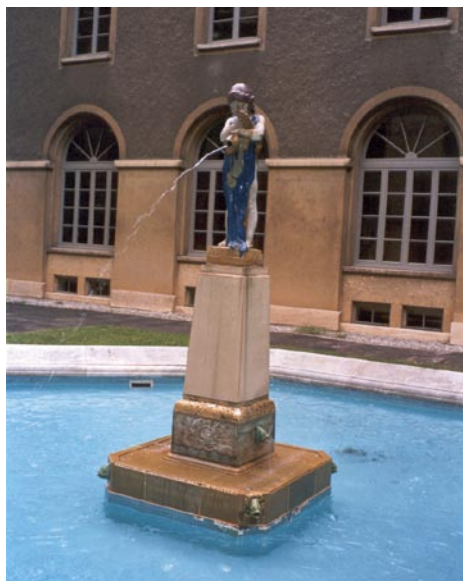
Cour de l'OMC, avec la fontaine conçue par l'artiste Gilbert Bayes

La cour intérieure située au rez-de-chaussée du CWR est occupée par une fontaine ornementale conçue par l'artiste Gilbert Bayes.