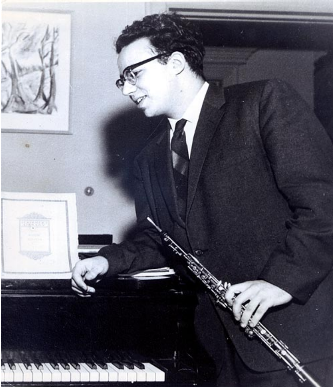
Jacques Héту, Montréal, 1958.

Tous droits réservés. La reproduction aux fins commerciales est interdite.