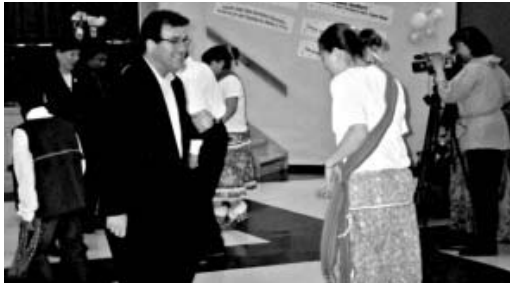
Le ministre Nault fait quelques pas de gigue avec les East Three Reelers, troupe de danse traditionnelle Gwich'in, qui ont lancé la cérémonie de signature. Le ministre a aussi appris quelques nouveaux pas de danse plus tard lorsque les danseurs Inuvialuit ont clôturé la cérémonie.