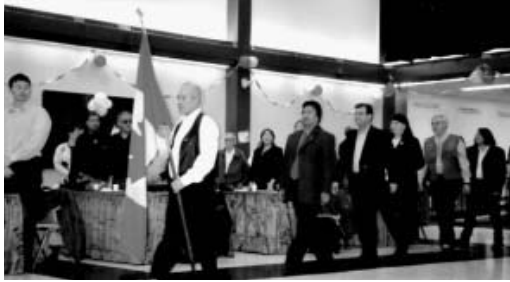
La cérémonie à Inuvik a débuté par un défilé. Les dignitaires étaient accompagnés jusqu'à l'estrade par des jeunes et des anciens Gwich'in et Inuvialuit qui portaient les drapeaux des quatre parties ayant pris part aux négociations.