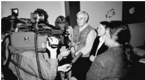
Les médias sont venus en grand nombre pour couvrir cette signature historique de l'EP sur l'autonomie gouvernementale des Gwich'in et des Inuvialuit. On voit ici Fred Carmichael, Nellie Cournoyea et le premier ministre Kakfwi qui répondent aux questions après la signature.