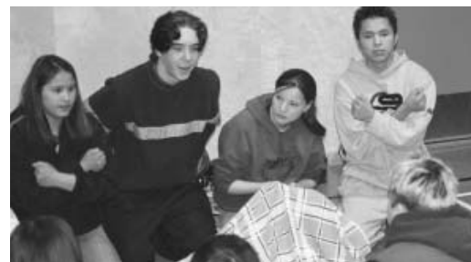
Des élèves de l'école Deh Gáh à Fort Providence divertissent la foule avec un jeu de mains.