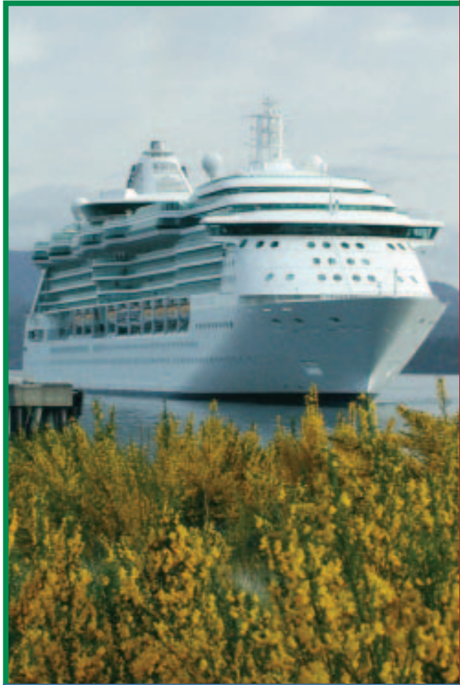
Des navires de croisière accosteront à Campbell River, en Colombie-Britannique.

Pour en savoir plus sur le Fonds de création de partenariats régionaux , consultez le site Web www.ainc-inac.gc.ca/ps/ecd/pas_f.html ou téléphonez sans frais au 1 800 567-9604 . Pour en savoir plus sur Diversification de l'économie de l'Ouest Canada , vous pouvez consulter son site Web à l'adresse www.wd.gc.ca . ■