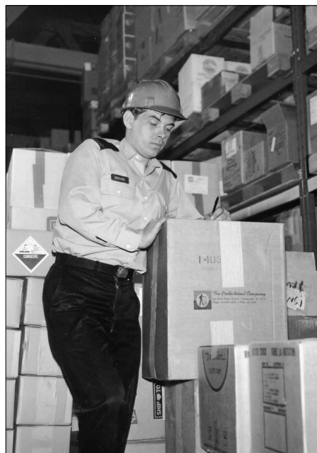
Les organisations d'approvisionnement des bases/escadres ne peuvent préciser si leur rendement s'est amélioré ou s'il s'est détérioré (voir le paragraphe 32.98).

Le système provisoire d'information n'offre que des moyens limités de mesurer la productivité de la gestion de l'approvisionnement.