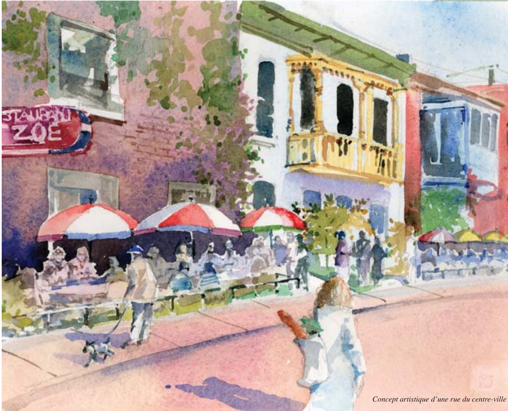
Concept artistique d'une rue du centre-ville