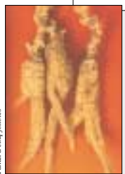
Bancs à cinq doigts