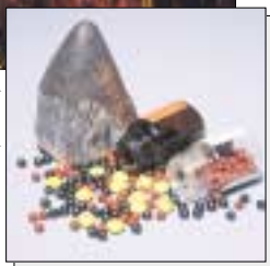
médicament traditionnel (rhinocéros)