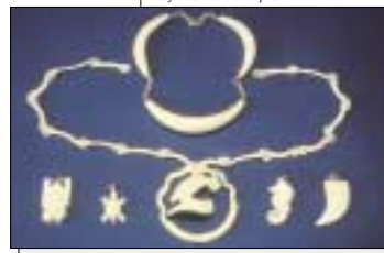
bijoux d'ivoire d'éléphant

Exemples : le buffle d'Inde (Népal), le kinkajou (Honduras), le Pigeon biset (Ghana), la vipère de Russell (Inde), le morse (Canada).