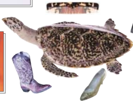
produits de la tortue de mer

Exemples : tous les lémurs, grands singes et de nombreux singes, la plupart des baleines et des rhinocéros, de nombreux ours, de nombreux félins, la plupart des éléphants, bon nombre d'éperviers et d'aigles, de nombreux faisans, les perroquets, les tortues, toutes les tortues marines, la plupart des crocodiles ...et nombre d'autres.