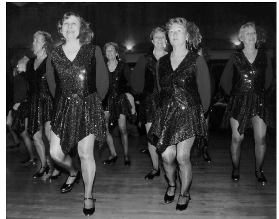
La troupe Oakville Happy Tappers à l'œuvre lors du lancement du Guide pour les aînés à Toronto au mois de mai dernier.

Si vous envisagez de passer votre retraite assis sur une chaise berçante les pieds bien au chaud dans vos pantoufles, repensez-y! Une version du Guide d'activité physique canadien destinée aux personnes de plus de 55 ans a été lancée le printemps dernier. Ce lancement a été souligné par une démonstration d'un groupe de danseurs à claquettes très habiles dont la moyenne d'âge était de 70 ans.