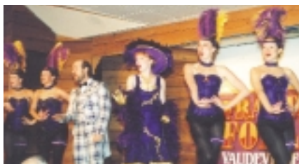
Les Frantic Follies, un spectacle provenant de l'époque de la ruée vers l'or, est une populaire attraction touristique.

Le paysage est en harmonie avec la nature et le règne animal. Le Yukon abrite 25 p. 100 des populations de Grizzlis du Canada. Au printemps, des centaines de milliers d'oiseaux migrent en colonies vers le nord. La baleine boréale et le béluga glissent dans les eaux glacées de la mer de Beaufort tandis que les phoques jouent sur les plages ou à proximité du rivage.