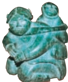
Inuit soapstone carving of kneeling mother and child, artist unknown Attributed to Baffin Island, N.W.T., circa 1950