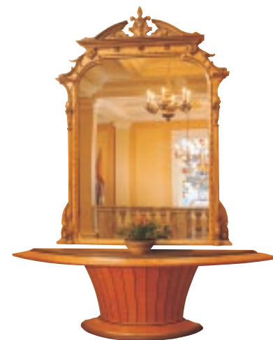
Console table, designed and made by Canadian furniture designer Michael C. Fortune in 2001