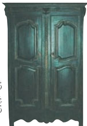
Armoire du Québec, de style Louis XV, vers 1750-1760