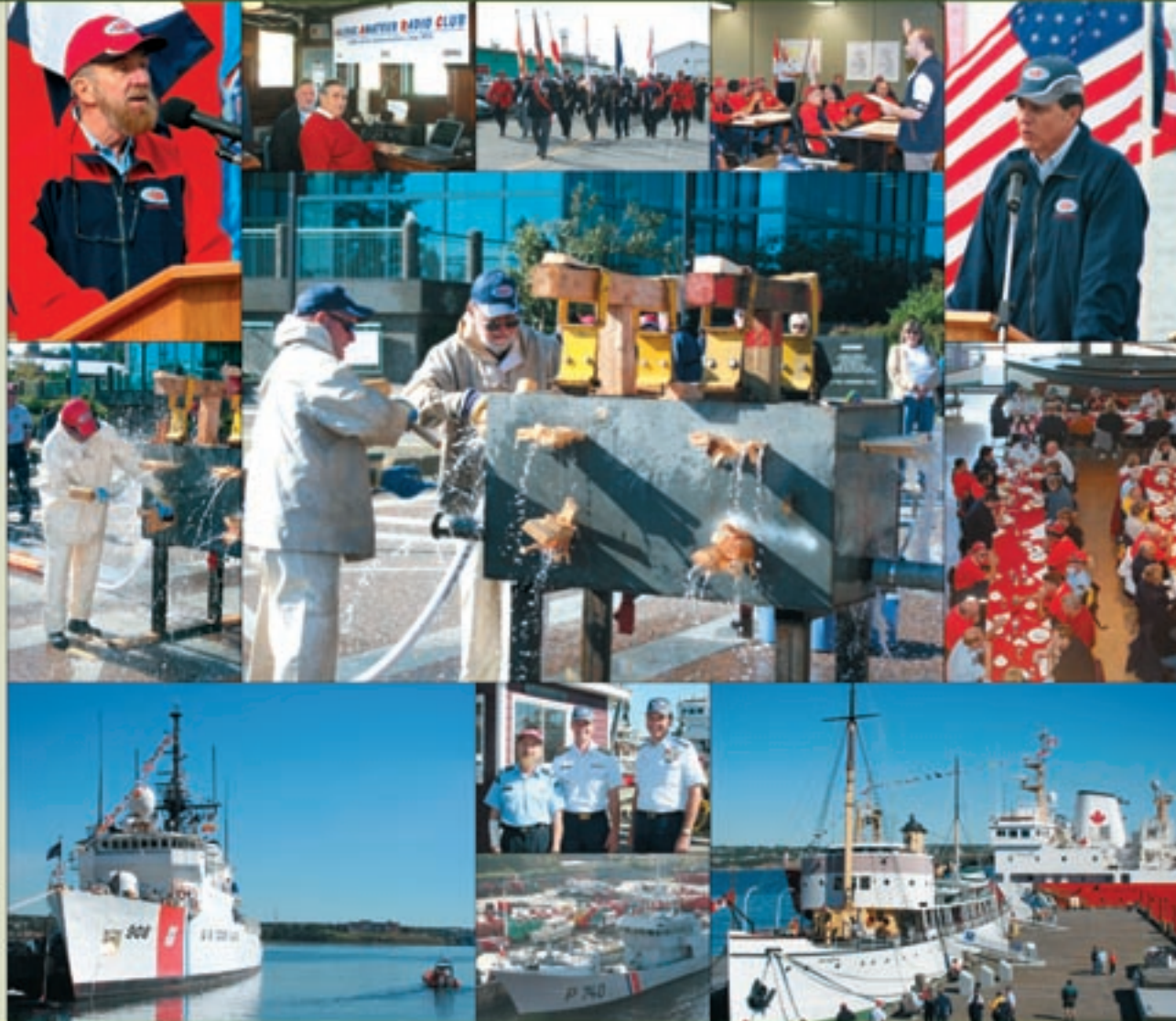
International SAR Competition, Halifax, NS, September 30, October 1, 2005 • Compétition SAR Internationale, Halifax, N.-É., 30 septembre et 1 er octobre 2005

Web Site • Site Internet www.ccg-gc.gc.org