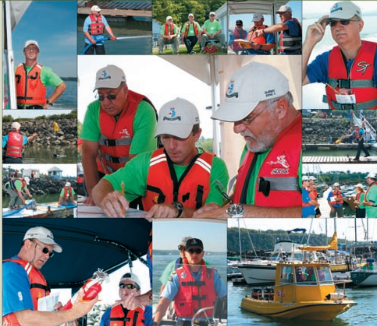
CCGA Quebec SAR Competition, Lévis, Québec, August 27, 2005 • Compétition SAR de la GCAC Québec, Lévis, Québec, 27 août 2005

Web Site • Site Internet www.ccg-a-gcac.org