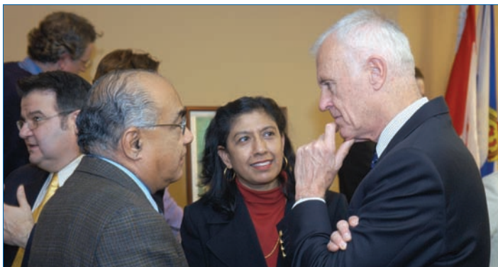
Le premier ministre John Hamm discute avec deux invités lors de la journée portes ouvertes.

Au cours de la première année de cette stratégie quinquennale, des bases solides ont été posées afin de mettre en œuvre la stratégie. La principale priorité était d'appuyer les activités qui aident les immigrants à s'établir avec succès. Des progrès considérables ont également été effectués dans les efforts visant à attirer un plus grand nombre d'immigrants, particulièrement par le biais du Programme des candidats de la Nouvelle-Écosse.