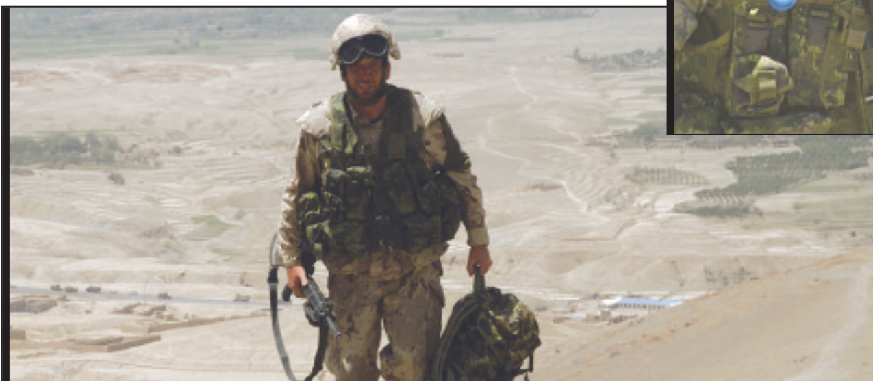
(Top and middle) - CF members continue to patrol areas of Afghanistan, some of it desolate in the extreme.