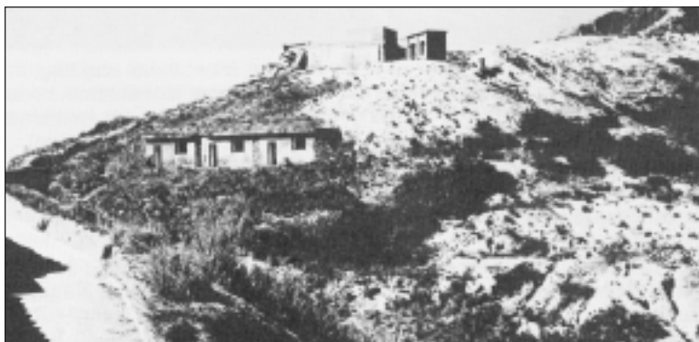
ROUTE MENANT DE LA STANLEY GAP ROAD AU JARDINE'S LOOKOUT.