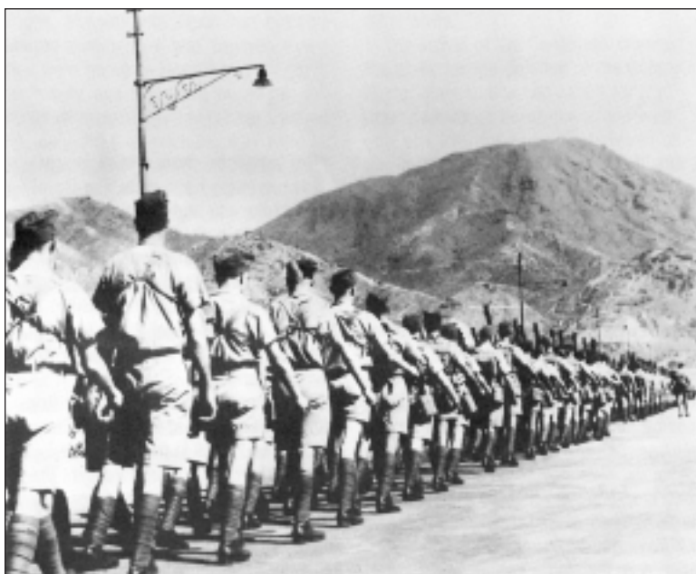
LE CONTINGENT CANADIEN À HONG KONG, 1941.