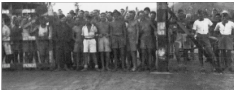
GROUPE DE PRISONNIERS CANADIENS ET BRITANNIQUES ATTENDANT D'ÊTRE LIBÉRÉS PAR L'ÉQUIPAGE DU NCSM PRINCE ROBERT .

La force de l'invasion fut incroyable. Le matin du 19, les Japonais avaient déjà atteint la zone des cols de Wong-Nei-Chong et de Tai-Tam, démontrant une fois de plus leur efficacité aux combats nocturnes.