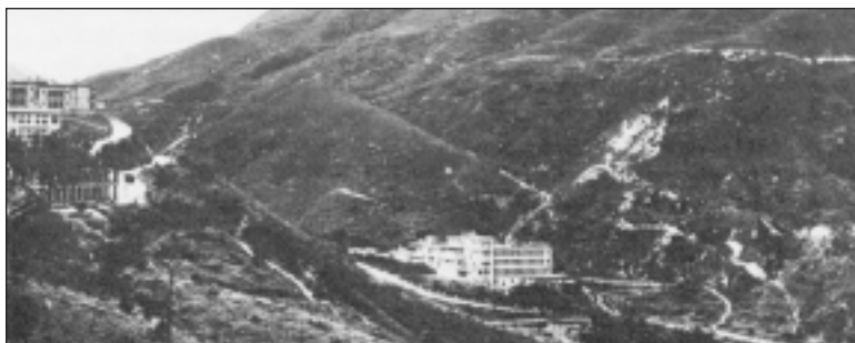
LA MISSION SALÉSIENNE, VUE DE LA CASERNE DE LYE-MUN; À L'ARRIÈRE LE MONT PARKER.

d'importance vitale et couler les navires qui resteraient dans le port afin qu'ils ne tombent pas entre les mains de l'ennemi. Le reste des forces sur l'île de Hong Kong devait préparer la défense contre toute attaque japonaise venant de la mer.