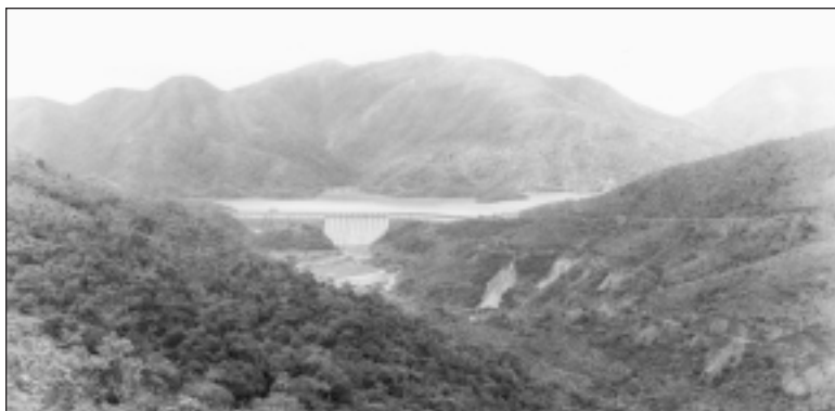
RÉSERVOIR DE TY TAM TUK.

Hong Kong ne possédait pas une défense navale adéquate. Tous les navires importants avaient été retirés et il ne restait que le contre-torpilleur NSM Thracian , plusieurs canonnières et une flottille de vedettes-torpilleurs à moteur.