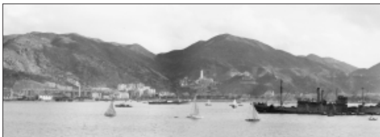
UNE VUE DE L'EST DE HONG KONG PRISE DU NCSM PRINCE ROBERT , 19 NOVEMBRE 1941.

La bataille de Hong Kong s'est soldée par de lourdes pertes humaines. Environ 290 soldats canadiens furent tués au combat et quelque 267 prisonniers de guerre canadiens moururent en captivité, portant le nombre total de morts à 557. En outre, près de 500 Canadiens furent blessés. Sur les 1 975 Canadiens qui se rendirent à Hong Kong, plus de 1 050 furent tués ou blessés, ce qui se traduit par un taux de pertes de plus de 50 p. cent. Il s'agit sans doute de l'un des taux de pertes les plus élevés subis par les troupes canadiennes dans un même théâtre d'opération au cours de la Seconde Guerre mondiale.