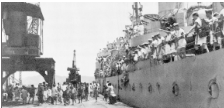
LE PRINCE ROBERT À CÔTÉ DE LA JETÉE PENDANT LA LIBÉRATION DE HONG KONG, AOÛT 1945.