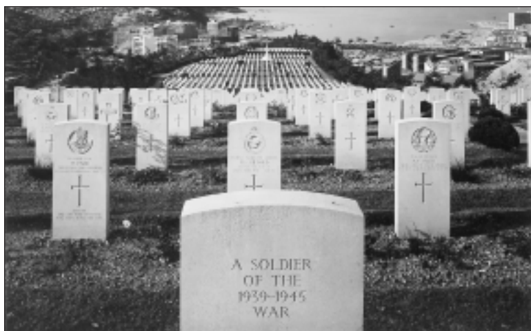
LE CIMETIÈRE DE GUERRE DE LA BAIE DE SAI-WAN.

Le Cimetière de guerre du Commonwealth britannique de Yokohama est situé à Hodogaya, près de Yokohama, où se trouve le seul cimetière du Commonwealth britannique au Japon. C'est là que reposent 137 Canadiens, la plupart morts en captivité dans les camps de détention japonais auprès de leurs camarades de la Nouvelle-Zélande, sous une croix du Sacrifice, dans une des quatre sections du cimetière.