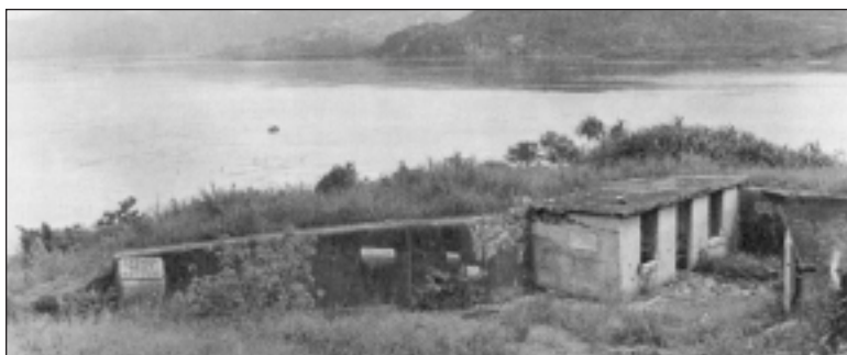
BATTERIE DU DÉTROIT DE LYE-MUN. (MUSÉE CANADIEN DE LA GUERRE P-149)

La colonie ne possédait aucune importante défense aérienne ou navale. La base de la Royal Air Force (RAF) de Kai-Tak à Hong Kong ne possédait que cinq appareils soit deux Walrus amphibies et trois bombardiers-torpilleurs Vickers Vildebeeste, dont l'entretien et le vol étaient assurés par 7 officiers et 108 aviateurs. On avait rejeté la demande antérieure d'un escadron de chasseurs. La station entièrement opérationnelle de la RAF la plus rapprochée se trouvait à Kota Bharu en Malaisie à près de 2 250 kilomètres.