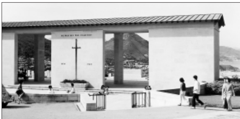
LE MÉMORIAL DE LA BAIE DE SAI-WAN.

D'abord, ils tentèrent une percée le long des côtes de la baie Repulse en espérant atteindre le col Wong-Nei-Chong et la brigade de l'Ouest. Ils réussirent à déloger l'ennemi d'une zone qui s'étendait autour de l'hôtel de la baie Repulse, mais furent incapables de chasser les Japonais de leurs positions dans les collines avoisinantes et furent forcés de se replier. Une compagnie des Royal Rifles fut laissée sur place pour occuper la zone. Le 21 elle tenta à nouveau de briser la ligne. Vint ensuite une tentative pour atteindre Wong-Nei-Chong en passant plus à l'est. En dépit de l'opposition violente de l'ennemi au sud du réservoir Tai-Tam-Tuk, les Royal Rifles réussirent à déloger les Japonais de certaines de leurs positions dans les collines et à détruire un groupe tenant le carrefour de l'extrémité sud du réservoir.