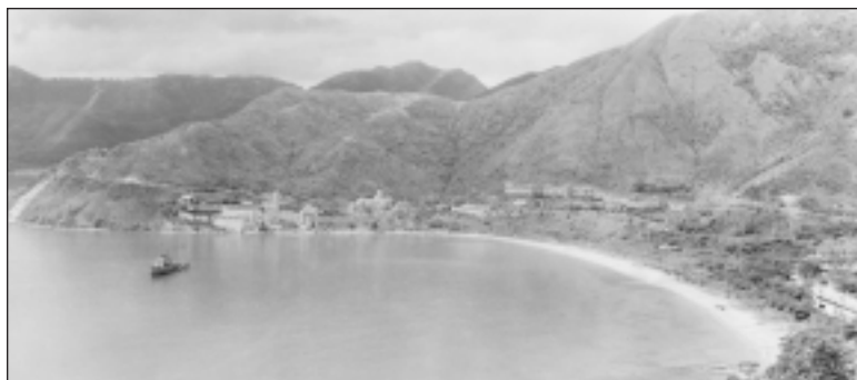
L'HÔTEL REPULSE-BAY, THÉÂTRE DE LA BATAILLE OÙ COMBATTIRENT LES ROYAL RIFLES OF CANADA DU 20 AU 22 DÉCEMBRE 1941.

revinrent toutefois sur leur décision en septembre 1941, alléguant que l'envoi de renforts servirait à dissuader les Japonais d'attaquer et rassurerait le dirigeant chinois Chiang Kai Shek en lui démontrant que la Grande-Bretagne avait la ferme intention de défendre la colonie. À cet effet, on demanda au Canada de fournir un ou deux bataillons.