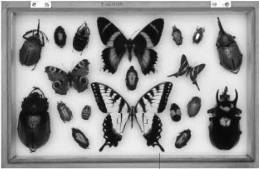
Numérisation de la collection nationale de sciences naturelles, avec 400 000 dossiers accessibles par voie électronique.