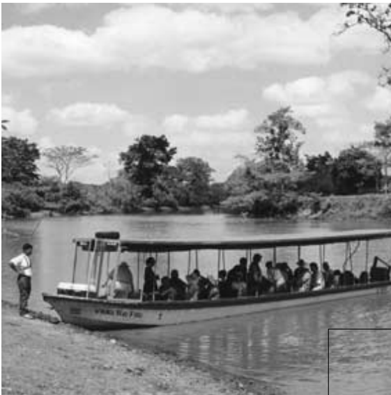
Le MCN a dirigé son premier voyage d'écotourisme à Costa Rica au printemps 2000.

Atteindre les objectifs en matière d'activités génératrices de revenus, de collecte de fonds et de ventes brutes par visiteur.