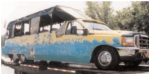
Le véhicule amphibie Lady Duck .

Le Secrétariat a constitué un groupe de travail pour