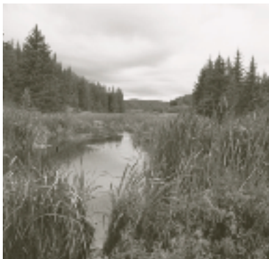
La forêt boréale du Canada joue des rôles vitaux, comme celui de purifier l'eau et l'air.

3.6 Les compétences en matière de biodiversité au Canada sont partagées entre les ministères et organismes fédéraux, notamment Environnement Canada, Pêches et Océans Canada, Agriculture