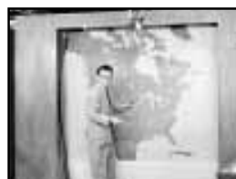
Percy Saltzman, Tabloid , 1954, Télévision anglaise.