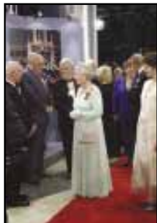
Lors de son jubilé, la reine visite le Centre de radiodiffusion de Toronto.