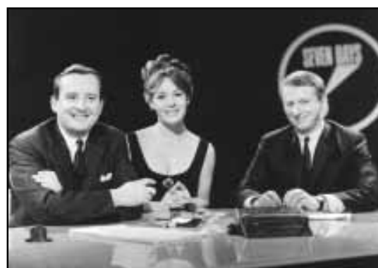
This Hour Has Seven Days, Télévision anglaise, de 1964 à 1966.