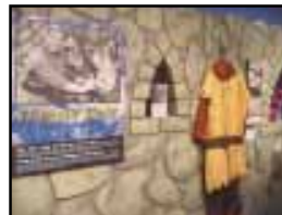
The Friendly Giant , de 1958 à 1984, Télévision anglaise.