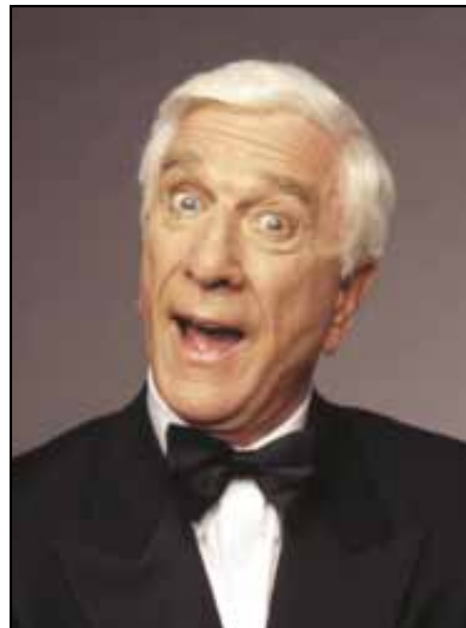
Leslie Neilson, The Joke's On Us: 50 Years of CBC Satire , Télévision anglaise