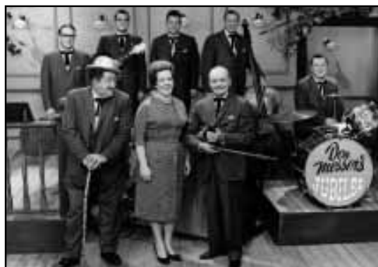
Don Messer's Jubilee, Télévision anglaise, de 1959 à 1969.