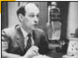
René Lévesque, ancien journaliste de CBC/Radio-Canada.