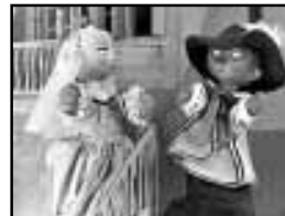
Pépinot et Capucine , Télévision française. Les marionnettes étaient une création de Jean-Paul Ladouceur.