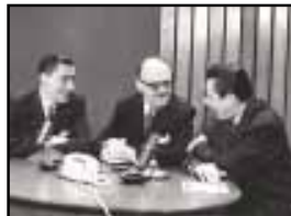
Roger Baulu, Jean Drapeau et Jacques Normand, Les Couche-tard , Télévision française.