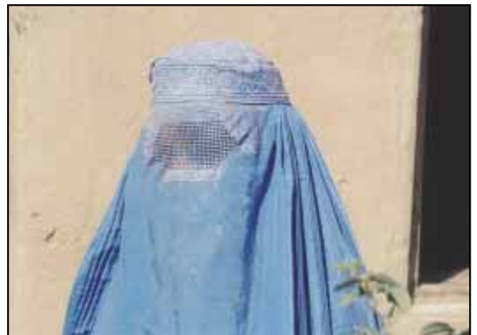
Daughters of Afghanistan, CBC Newsworld.

Dans les semaines qui ont précédé le déclenchement du conflit en Irak et pendant son déroulement, nous avons été là – bien préparés, bien informés et objectifs. Nous avons été les premiers réseaux au Canada à annoncer le déclenchement du conflit le 19 mars 2003. Nous avons déployé des ressources considérables pour couvrir le conflit et nous avons réaménagé nos horaires pour suivre, sans interruption et sans publicité, le fil des événements au jour le jour.