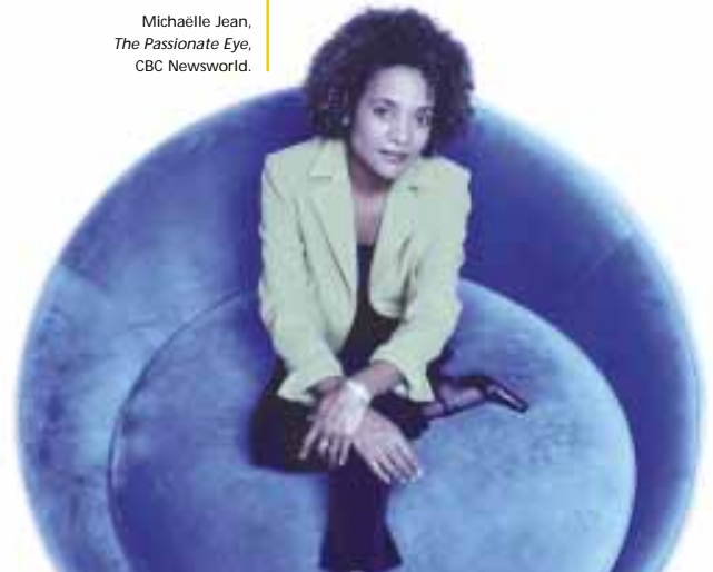
Michaëlle Jean, The Passionate Eye , CBC Newsworld.