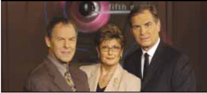
Linden MacIntyre, Hana Gartner et Bob McKeown, the fifth estate , Télévision anglaise.