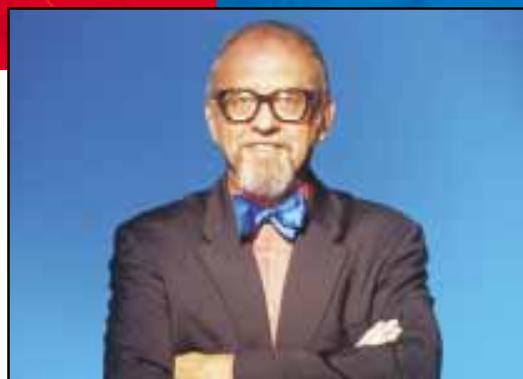
Michael Enright, The Sunday Edition , Radio anglaise.