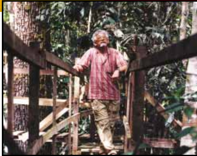
David Suzuki, The Sacred Balance , Télévision anglaise.