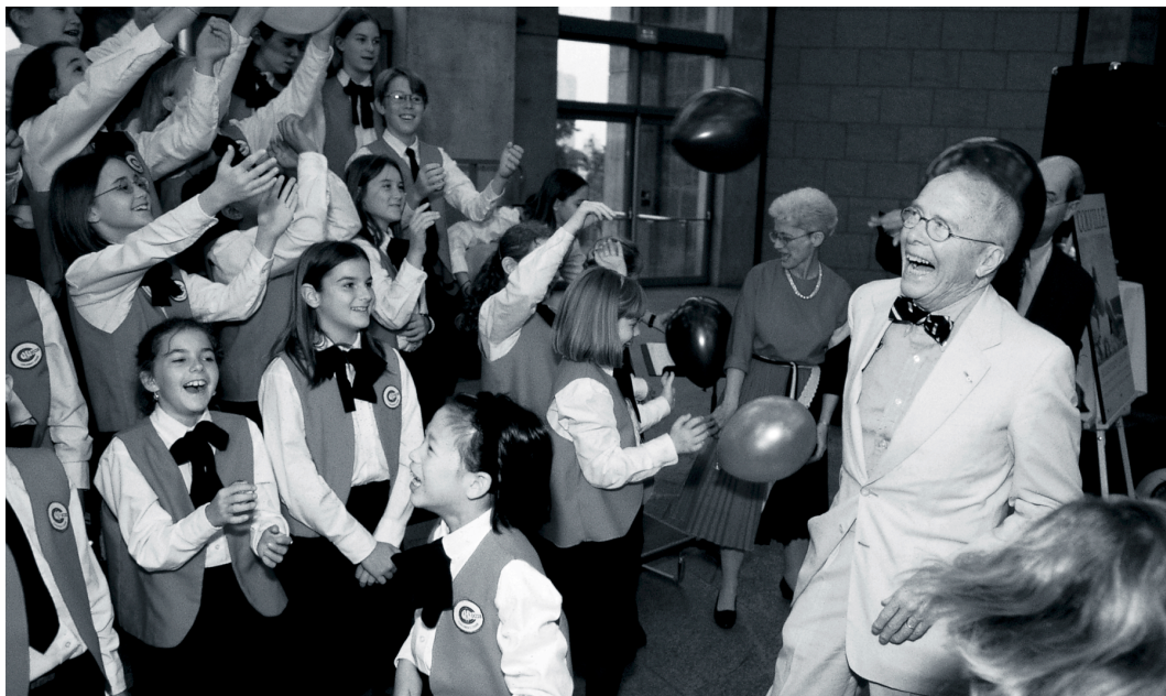
Alex Colville en compagnie des membres de l'Ottawa-Carleton Catholic School Board Children's Choir au cours de l'avant-première de presse de l'exposition Jalons et de la fête marquant le 80 e anniversaire de l'artiste

par une démarche classique. Présentée par le Groupe Investors, l'exposition était complétée par un encart de 16 pages dans la revue du Musée des beaux-arts, Vernissage , et par la projection en continu du film Ordre et splendeur réalisé par l'Office national du film.