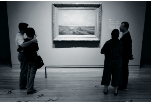
Inauguration de l'exposition Monet, Renoir et le paysage impressionniste