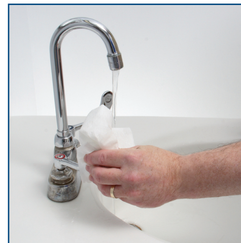
Turn off water with a paper towel. Servez-vous d'un essuie-tout pour fermer le robinet.