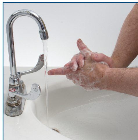
Clean the space between the thumb and index finger. Frottez la peau entre le pouce et l'index.