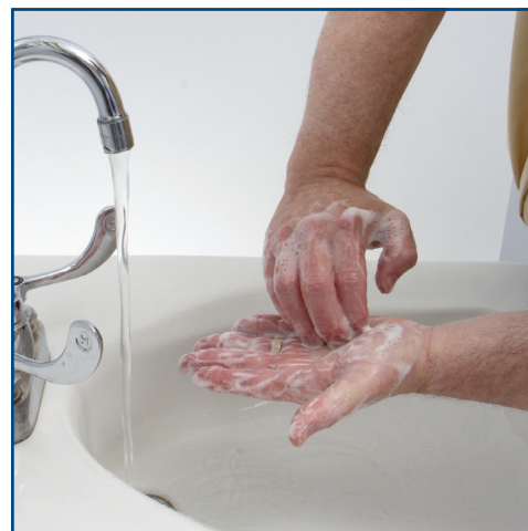
Work finger tips into the palms to clean under nails. Frottez le bout des doigts sur les paumes afin de nettoyer le dessous des ongles.