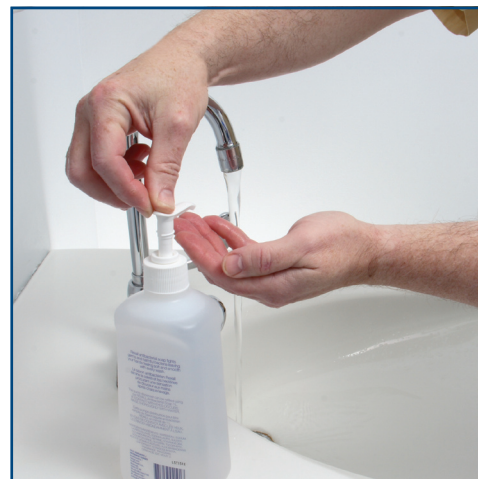
Add soap to palms. Ajoutez du savon sur les paumes.