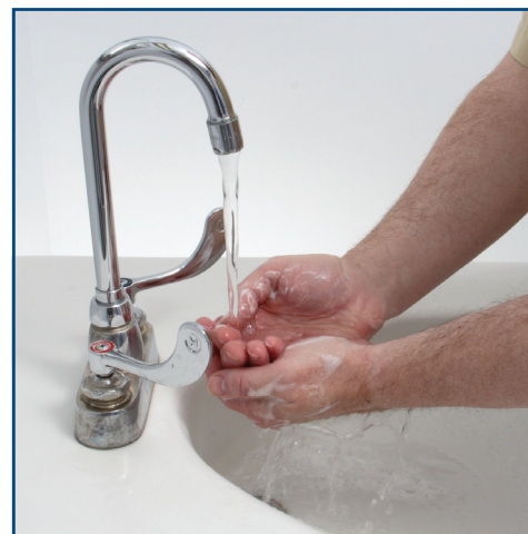
Rinse well under warm, running water. Rincez bien les mains à l'eau courante tiède.