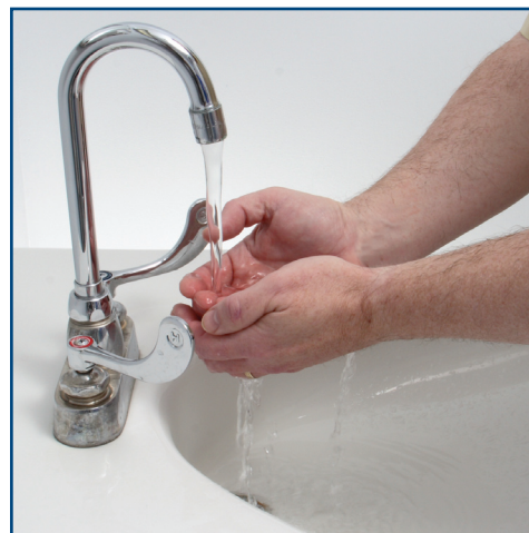
Wet hands with warm water. Mouillez-vous les mains sous l'eau tiède.