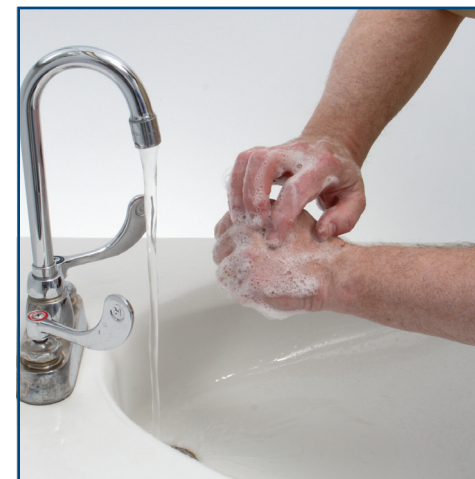
Clean knuckles, backs of hands and fingers. Frottez les articulations, le dos des mains et les doigts.