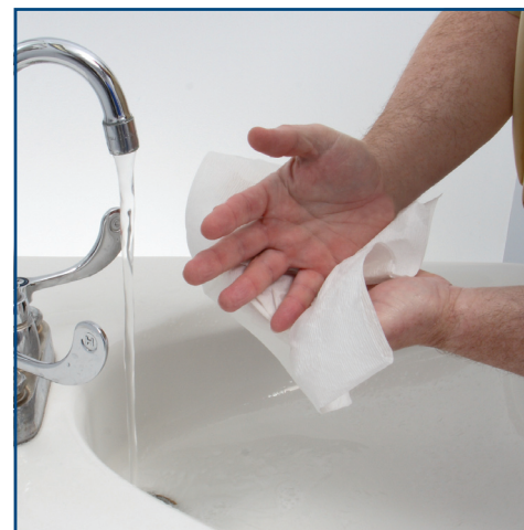
Dry with a paper towel. Essuyez-vous les mains avec un essuie-tout.