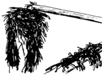
Le ratissage du fucus bifide

On engage des personnes pour racler les lits de fucus bifide. Depuis 1994, la province du Nouveau-Brunswick a établi des lignes de conduite, y compris une limite sur la récolte annuelle, et elle a exigé le respect d'un intervalle de trois ans entre les récoltes.