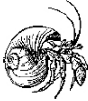
Le bernard l'hermite ( Pagurus pollicaris )

Si vous ramassez des objets, ayez une raison bien précise en tête et ne ramassez que les quantités dont vous avez besoin. Si vous voulez des objets pour faire de l'artisanat, assurez-vous qu'ils sont vides (le bernard l'hermite, par exemple, vit à l'intérieur de coquilles abandonnées).