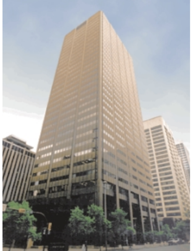
Fifth and Fifth