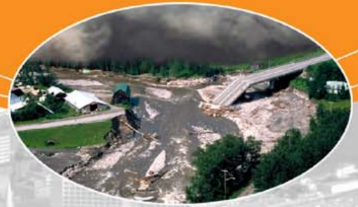
Les risques naturels et les interventions en cas d'urgence http://rnicu.nrcan.gc.ca

Lorsqu'une catastrophe se produit, le temps compte.