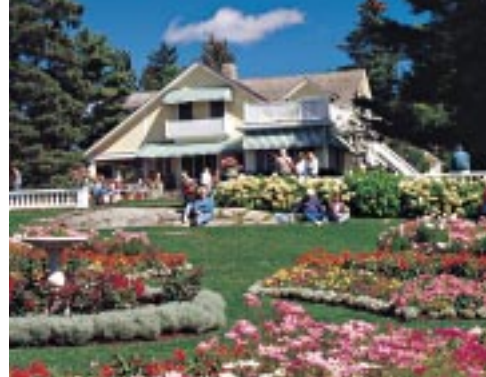
LE DOMAINE MACKENZIE-KING • MACKENZIE KING ESTATE