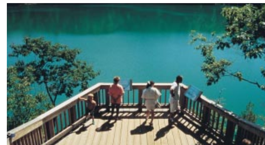
LE LAC PINK • PINK LAKE