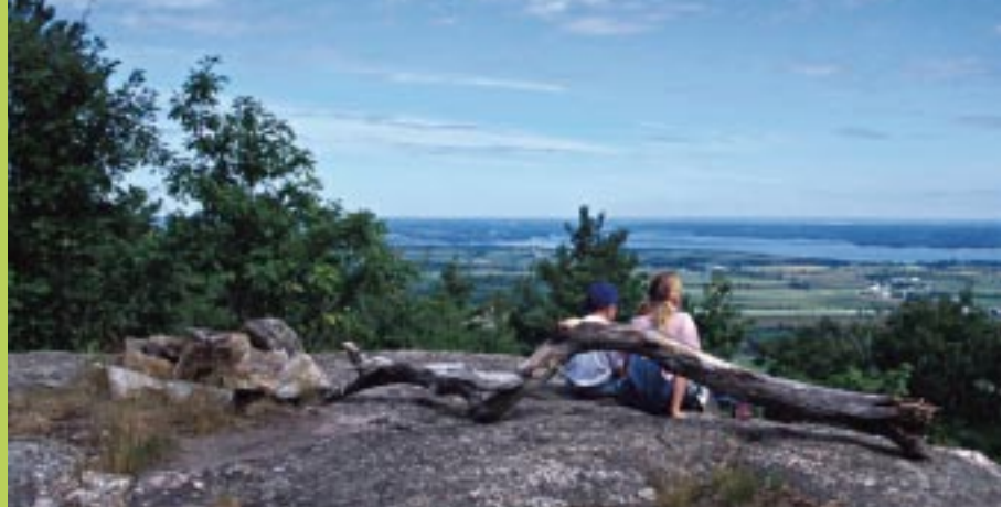
LA VALLÉE DE L'OUTAOUAIS • OTTAWA VALLEY