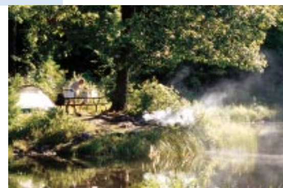
LE LAC TAYLOR • TAYLOR LAKE