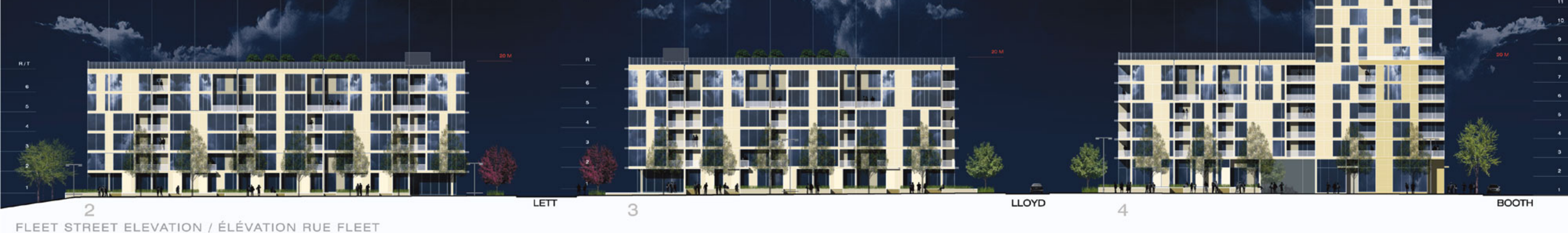
2 FLEET STREET ELEVATION / ÉLÉVATION RUE FLEET

“...a resolutely contemporary and luminous architecture of brick, stone and glass.” “...une architecture résolument contemporaine de brique, de pierre et de verre, empreinte de luminosité.”