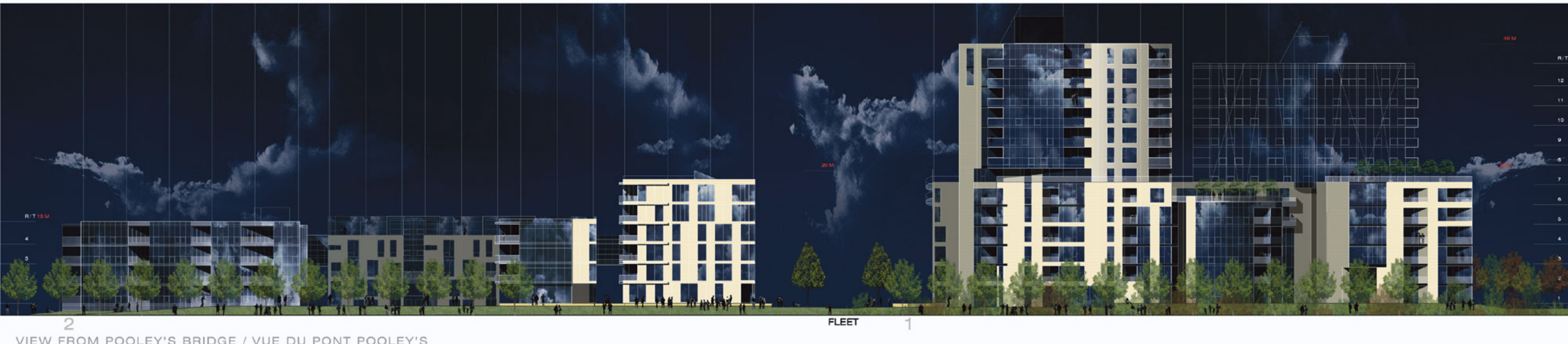
2 VIEW FROM POOLEY'S BRIDGE / VUE DU PONT POOLEY'S