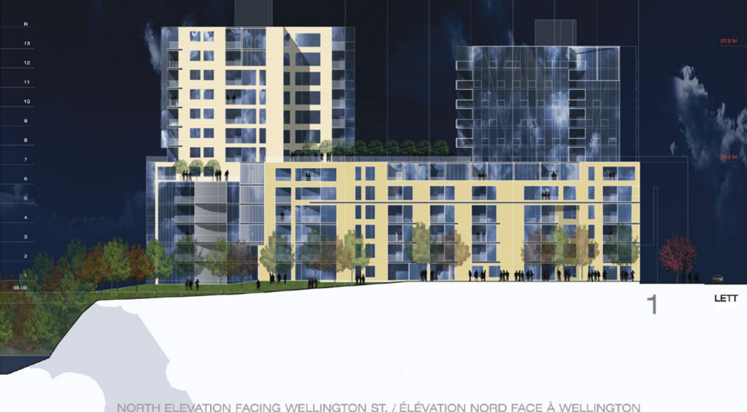
NORTH ELEVATION FACING WELLINGTON ST. / ÉLEVATION NORD FACE À WELLINGTON

"...an intricate volumetric composition, an architecture of details allowing the personalization of housing units." "...un traitement volumétrique articulé, une architecture de détails afin de personnaliser les unités d'habitation."