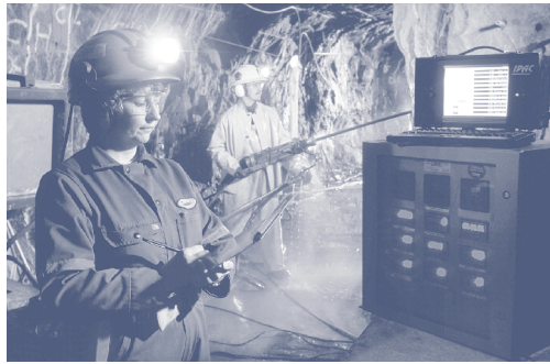
Installation souterraine à la Mine-laboratoire de CANMET-LMSM