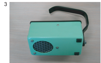
contaminamètre plat de 15 cm 2

3. Photographie d'un contaminamètre Technical Associates TBM-3S