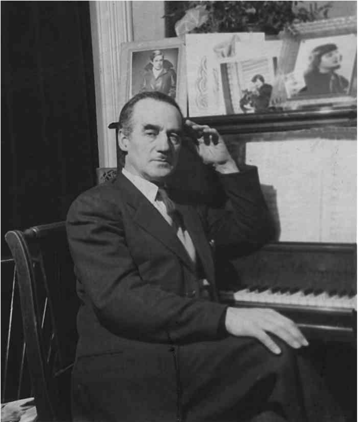
Rodolphe Mathieu, Montréal, [ca 1950]. Tous droits réservés. La reproduction aux fins commerciales est interdite.