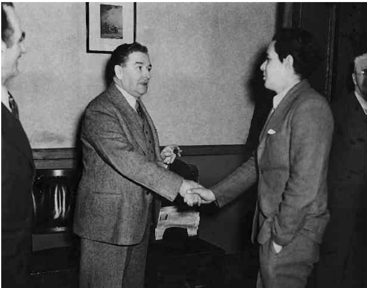
André Mathieu et le Premier ministre du Québec Maurice Duplessis, [ca 1946]. Photographie : Service de ciné-photographie de la province de Québec. Tous droits réservés. La reproduction aux fins commerciales est interdite.

Dossier constitué principalement de photographies d'André Mathieu avec des membres de sa famille ainsi qu'avec des amis. Le dossier contient également deux photographies d'André Mathieu avec Maurice Duplessis.