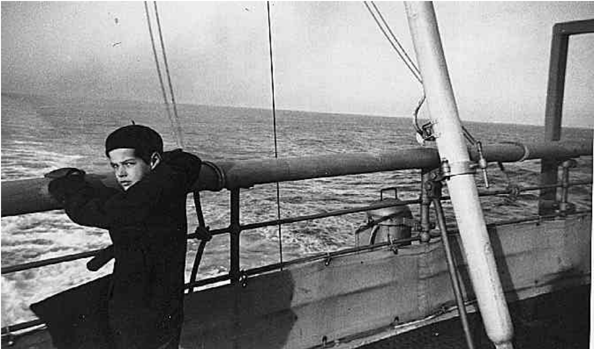
André Mathieu vers l'âge de 8 ans, [ca 1937]. Tous droits réservés. La reproduction aux fins commerciales est interdite.