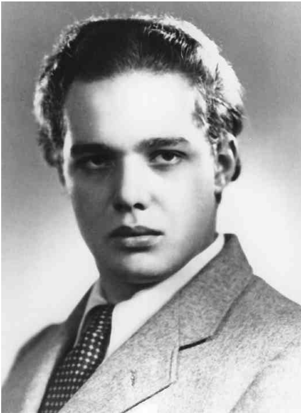
André Mathieu, [ca 1946]. Tous droits réservés. La reproduction aux fins commerciales est interdite.