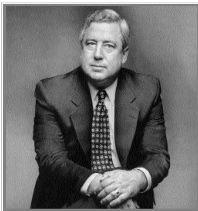
Ian E. Wilson Yanishevsky Tardioli Photography

C'est là, en fait, la mission des Archives nationales du Canada — préserver la mémoire collective de la nation et la rendre accessible aux Canadiens, les relier aux sources de leur passé et à leur histoire personnelle et collective. En ma qualité d'Archiviste national récemment nommé, j'ai cerné deux grandes priorités, lesquelles s'insèrent dans la stratégie générale du gouvernement qui est d'établir des liens entre les Canadiens. Ces deux priorités des Archives nationales, pour la période allant de l'an 2000 à 2003, s'inscrivent sous les rubriques générales « Servir les Canadiens » et « Garantir de l'intégrité de l'information gouvernementale ».