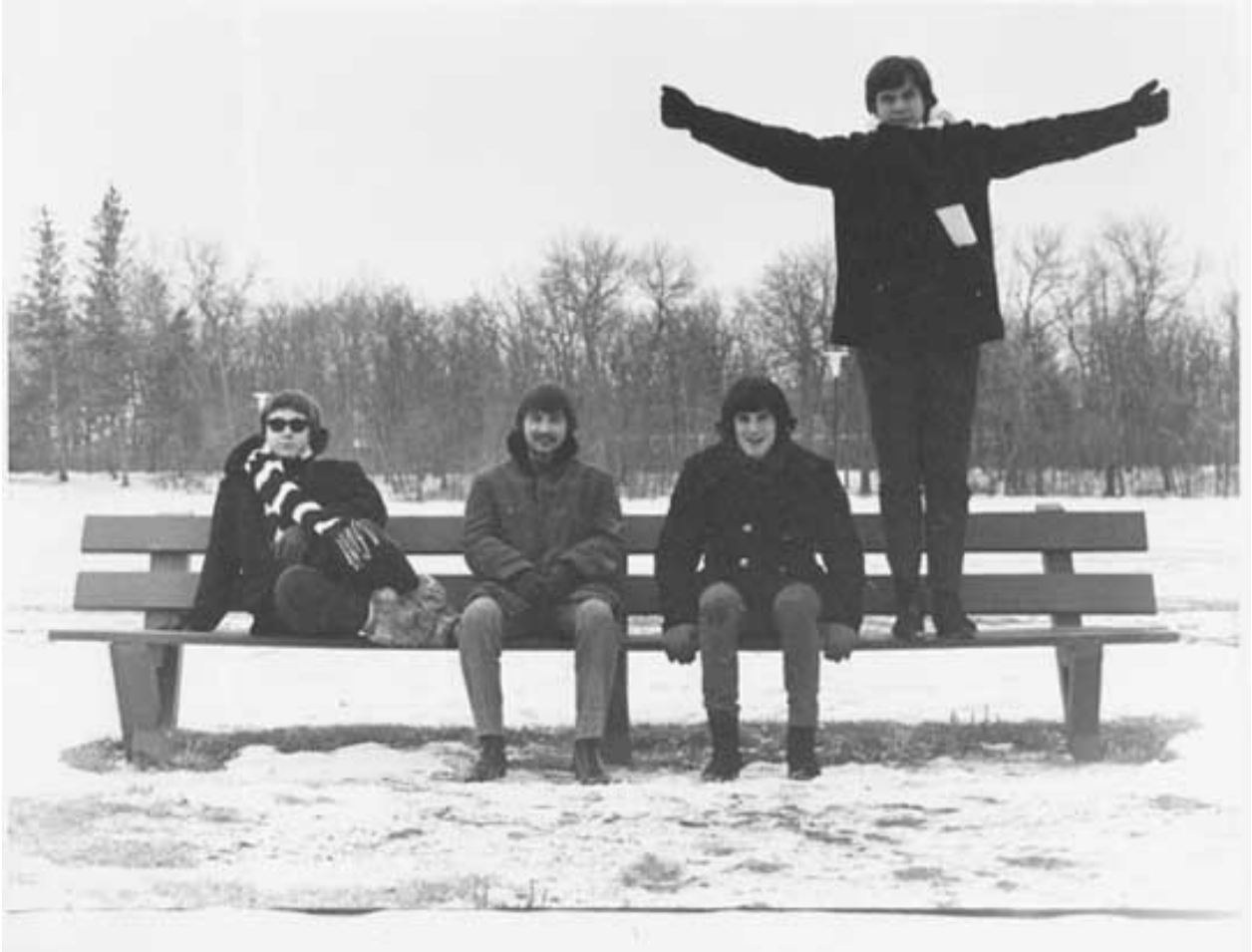
Le groupe Guess Who (de g. à dr.) : Garry Peterson, Jim Kale, Burton Cummings et Randy Bachman. (Photo prise pour l'émission «Let's Go» au réseau anglais de la SRC, Winnipeg, 1967).