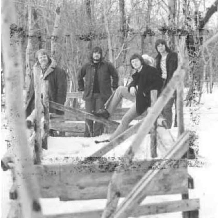
Le groupe Brave Belt (de g. à dr.) : Charles F. Turner, Randy Bachman, Chad Allan et Robbie Bachman, 1971.