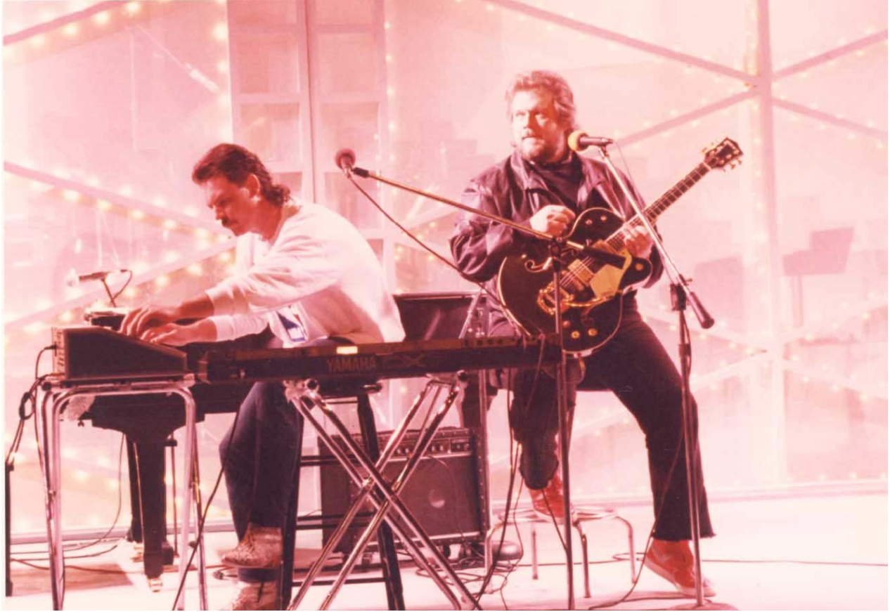
Burton Cummings et Randy Bachman. (Photo prise lors de l'émission spéciale «Variety Club Telethon» au réseau anglais de la SRC, Toronto, 1987).