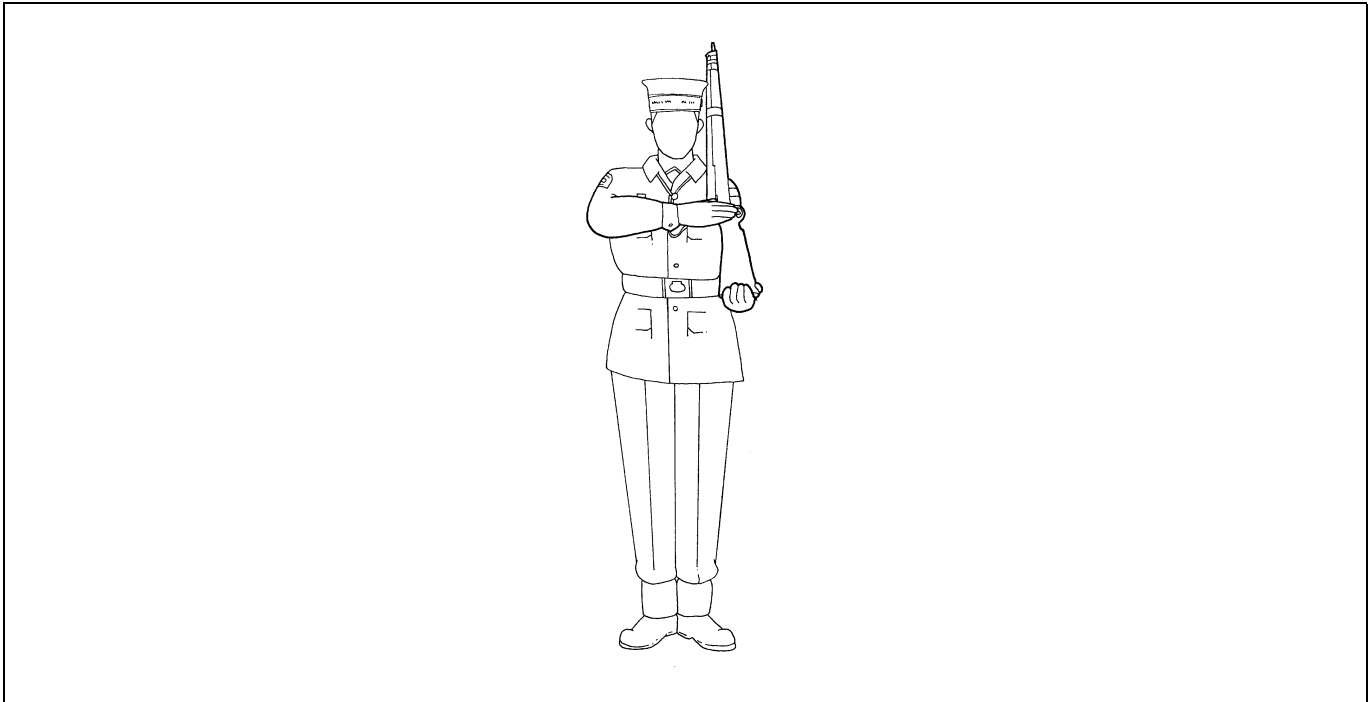
Figure 2-23 Saluting at Slope Arms

2. Au commandement « ESCOUADE—DEUX », les membres de l'escouade doivent ramener la main droite sur le côté du corps comme dans la position du garde-à-vous.