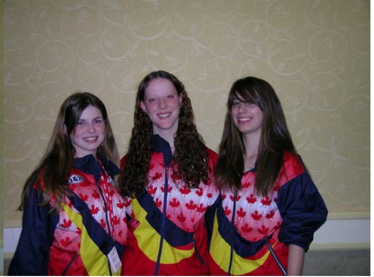
British Columbia Unit Female Team