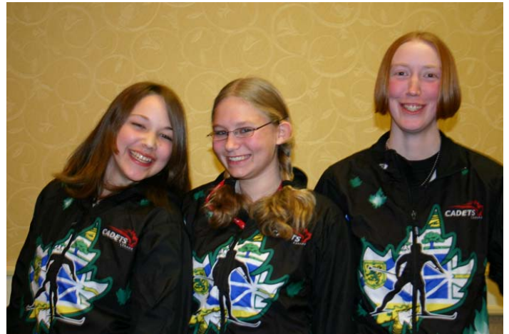
Prince Edward Island Unit Female Team