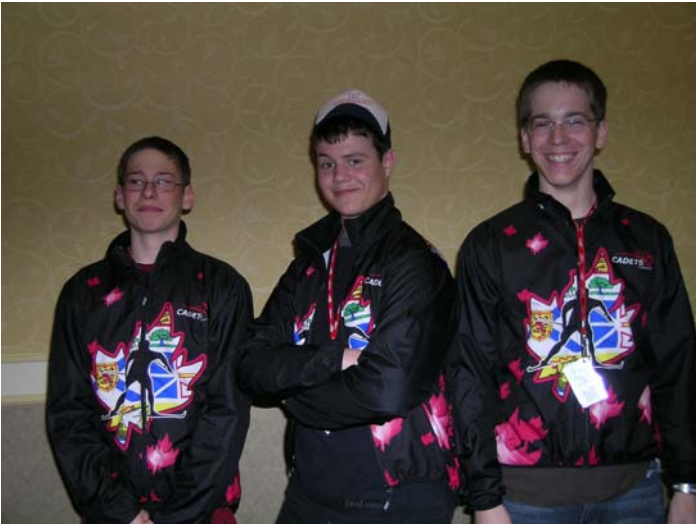
New Brunswick Unit Male Team