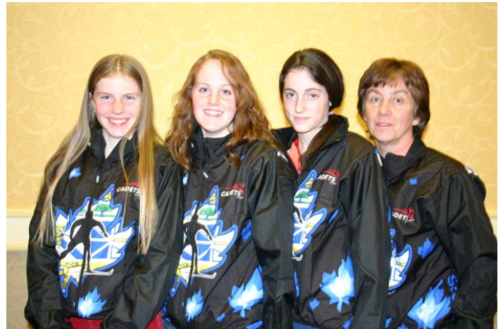
Nova Scotia Unit Female Team