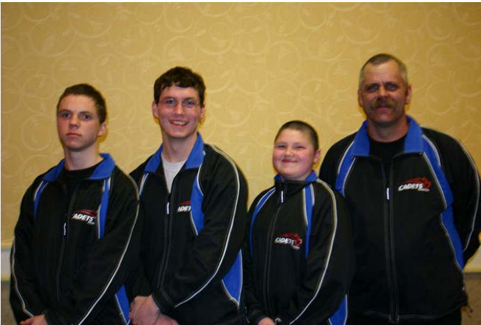
Northern Region Composite Male Team