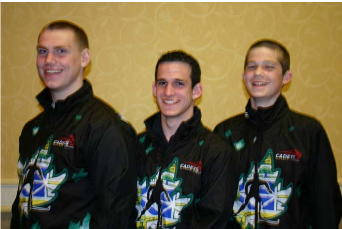
Prince Edward Island Composite Male Team