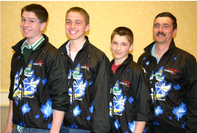
Nova Scotia Unit Male Team