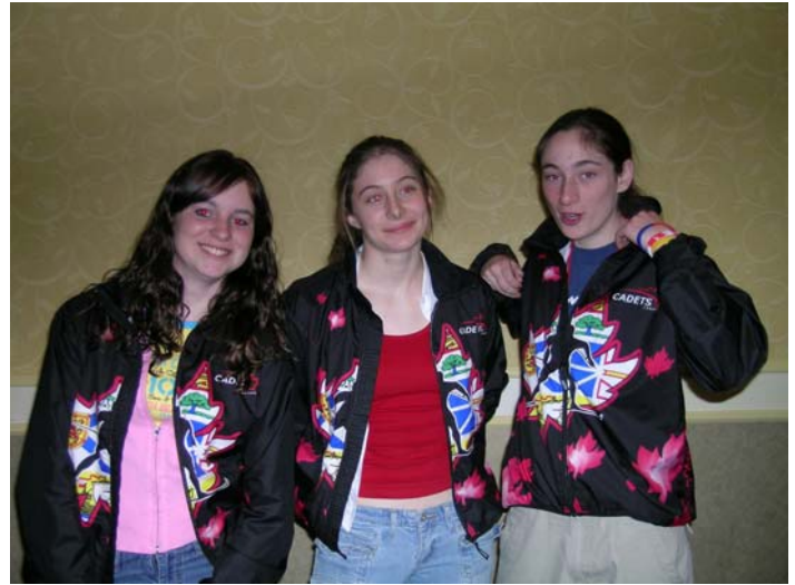
New Brunswick Unit Female Team