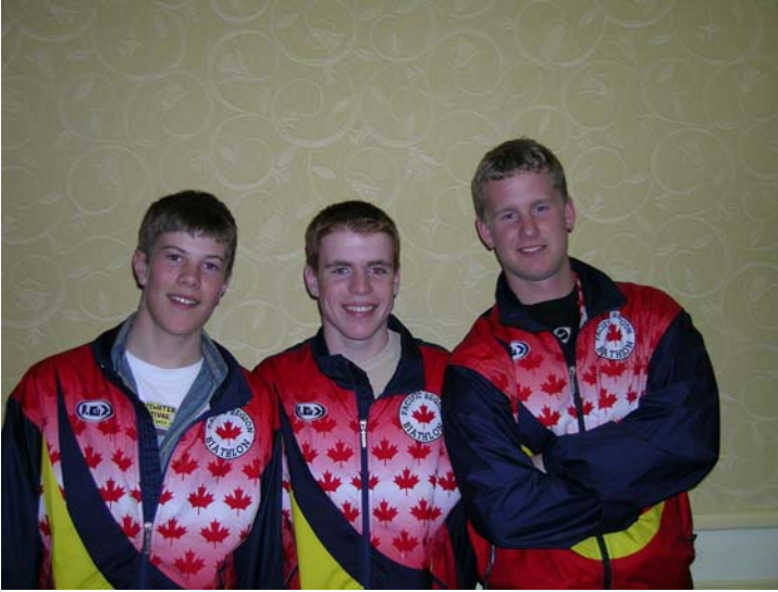
British Columbia Unit Male Team