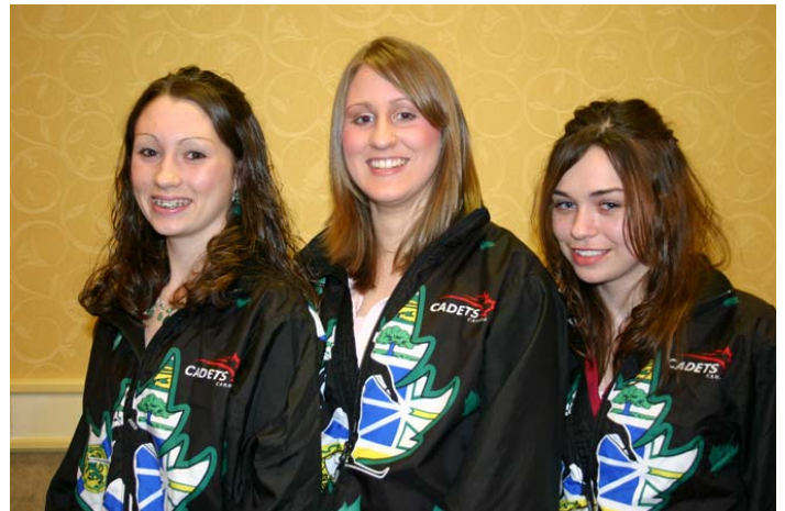
Prince Edward Island Composite Female Team