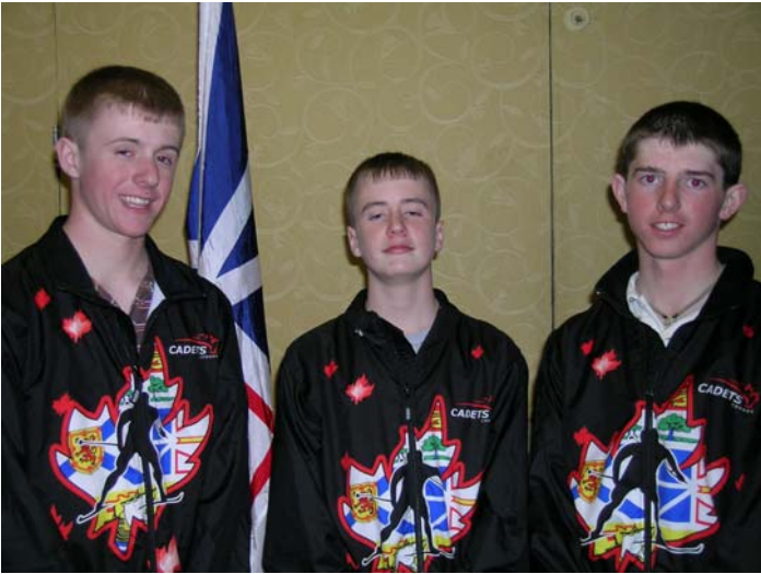
Newfoundland Unit Male Team