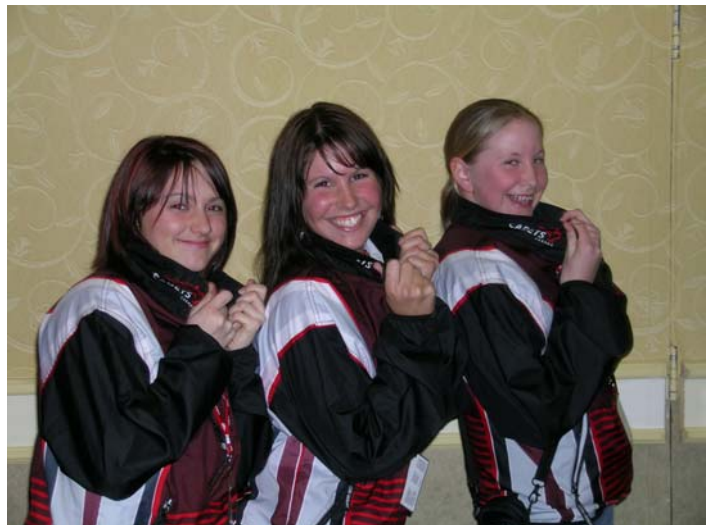
Ontario Female 1 Composite Team