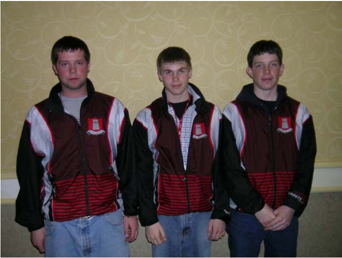
Ontario Unit Male Team