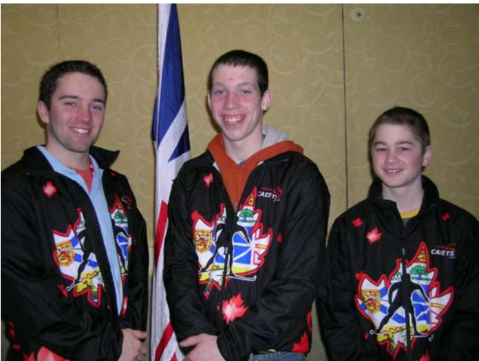
Newfoundland Composite Male Team