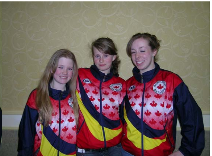
British Columbia Composite Female Team