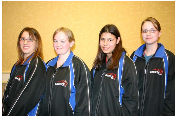
Northern Region Composite Female Team