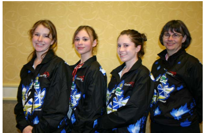
Nova Scotia Composite Female Team