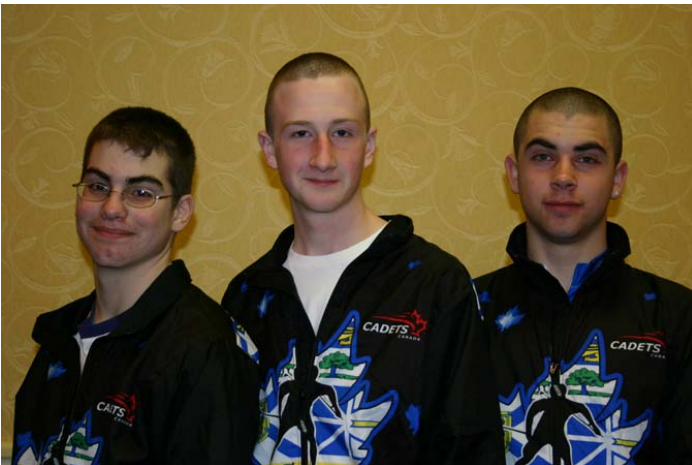
Nova Scotia Composite Male Team,