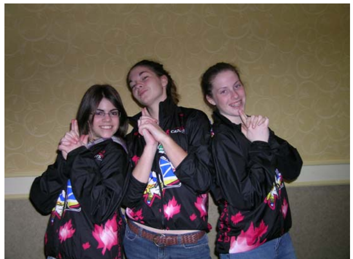
New Brunswick Composite Female Team