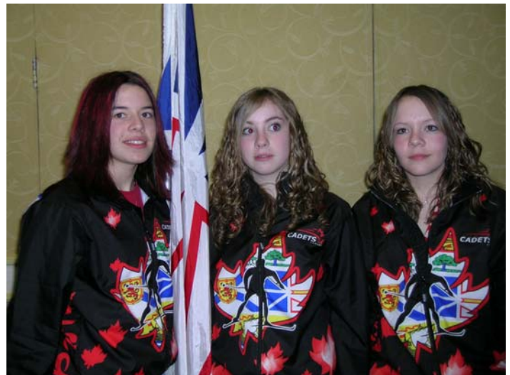
Newfoundland Composite Female Team