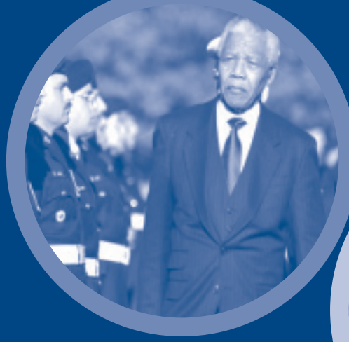
Nelson Mandela lors de son passage à Rideau Hall (1998)