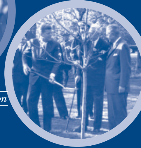
John F. Kennedy lors de la plantation de l'arbre commémoratif à son nom (1961)