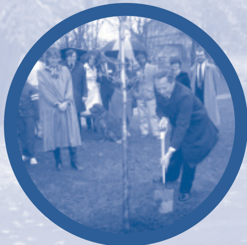
Le Gouverneur général Edward Schreyer lors de la plantation de l'arbre commémorant son mandat à Rideau Hall