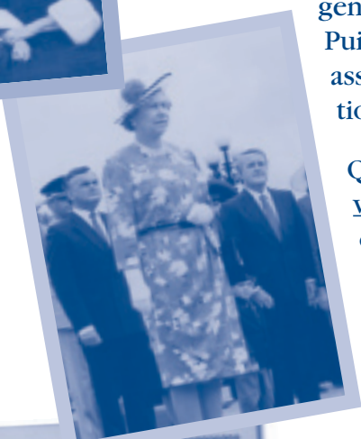
Sa Majesté la reine Elizabeth II en compagnie du Gouverneur général Ramon J. Hnatysbyn et du Premier ministre Brian Mulroney (1990)