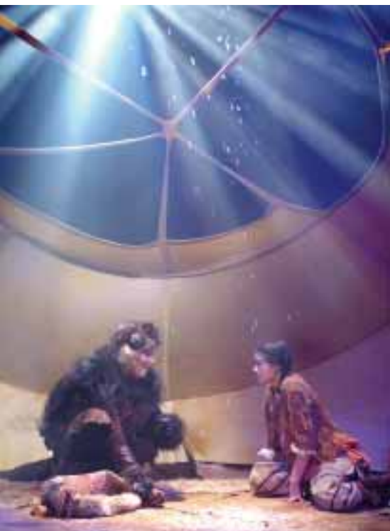
Photo © Louise Lablanc / Conédiens - Dove Jemias et Valérie Deschêreaux

4 à 8 ans Texte et mise en scène de Jean-Frédéric Messier Une création du Théâtre des Confettis