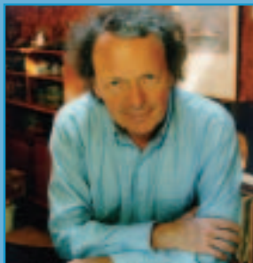
Anton Kuerti

ALL CONCERTS IN THIS SERIES ARE IN / TOUS LES CONCERTS DE CETTE SÉRIE ONT LIEU À : 19:30 SALLE SOUTHAM HALL