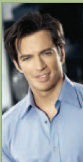
Harry Connick Jr.