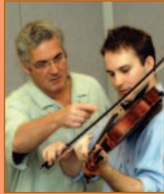
Pinchas Zukerman masterclass / atelier de maître

Une occasion unique de mieux apprécier la musique en assistant au processus de création. Apprenez avec les grands maîtres, en compagnie de participants l'IEM triés sur le volet.