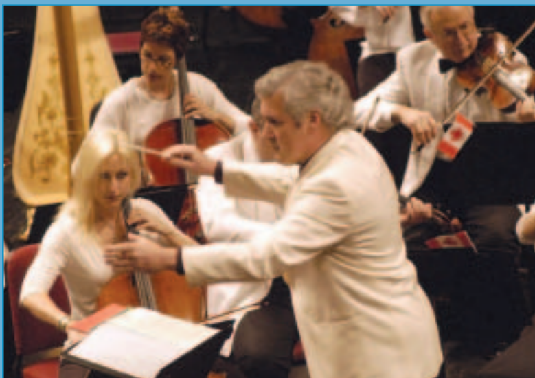
Pinchas Zukerman and NAC Orchestra / et l'Orchestre du CNA

Ces concerts sont inclus dans le prix du billet de chaque concert de la série Les Grands Compositeurs.