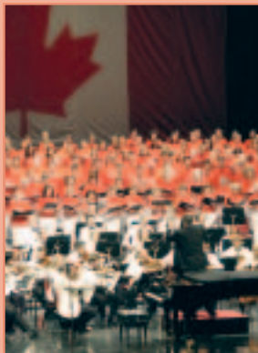
NAC Orchestra and Unisong L'Orchestre du CNA et Unisong