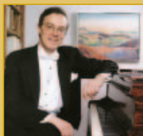
Peter Serkin

MOZART Piano Quintet No. 6 / Quintette avec piano n° 6