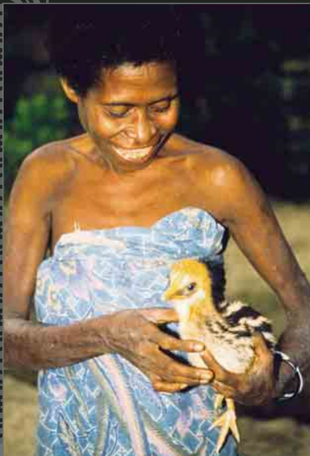
Moi woman with cassowary chick. Femme de la tribu Moi avec un petit casoar.

Enfants de la région côtière, sur l'île de Biak. De nombreux habitants de Papouasie occidentale vivent dans les régions côtières, comme ces enfants de l'île de Biak, située juste au nord de la province. Considérée comme une partie de la Papouasie occidentale, l'île de Biak constitue l'un des principaux centres du mouvement indépendantiste.