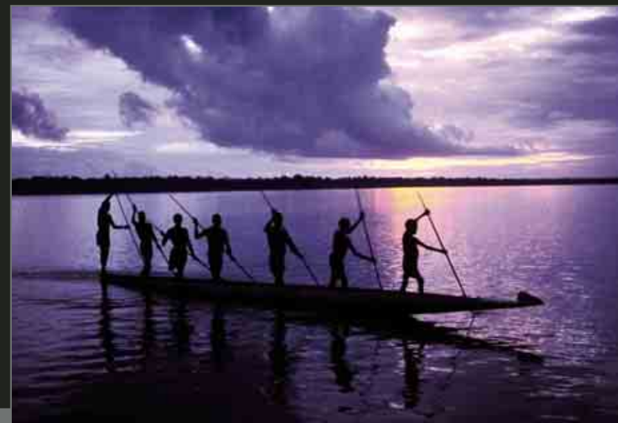
Asmat boatmen. Bateliers de la tribu Asmat.