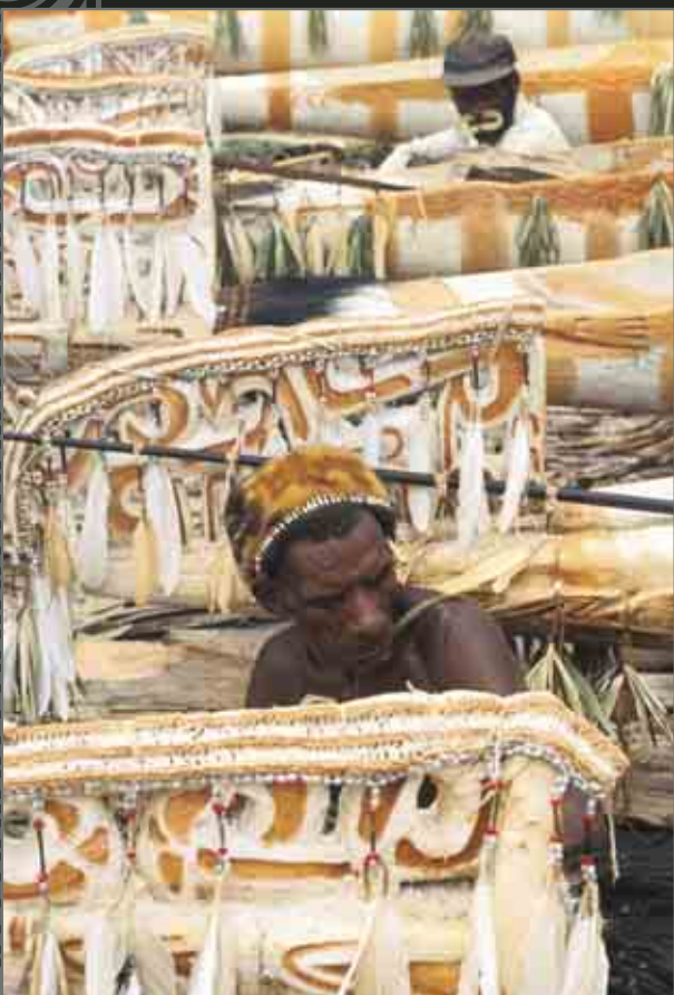
Asmat canoes. Canots utilisés par les Asmat.