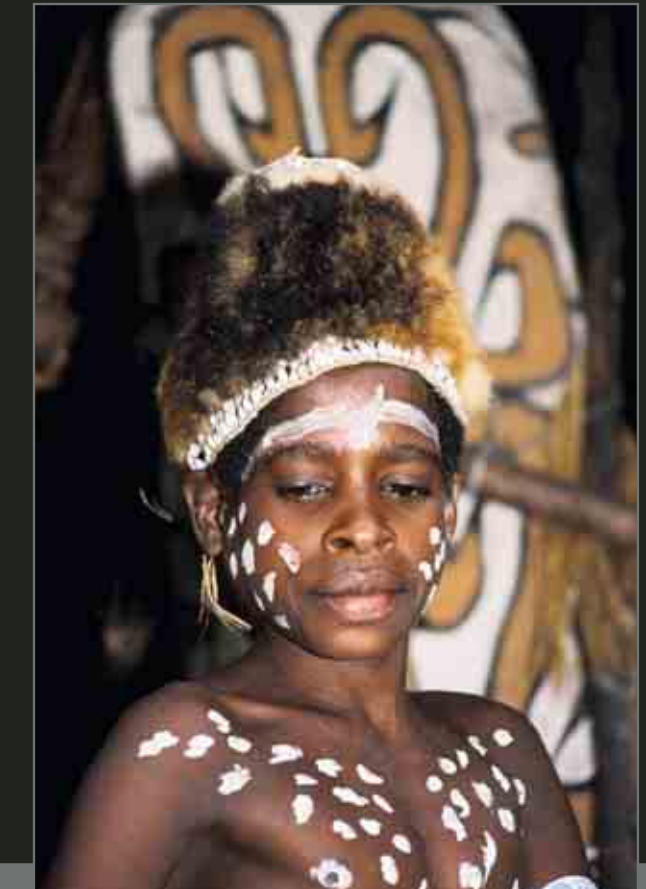
Asmat boy. Garçon de la tribu Asmat.