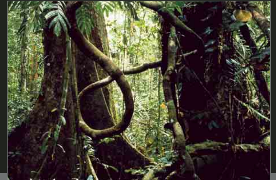
Yapen Island. Lowland rainforest. Île de Yapen. Forêt pluviale des basses terres.