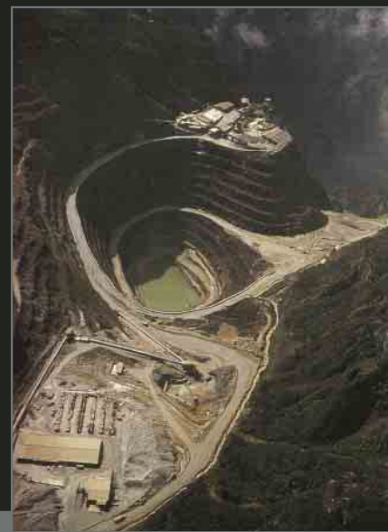
The Freeport copper and gold mine: The US/British (Freeport McMoran/RioTinto) owned mine is based in the Western Highlands. It is the largest mine of its type in the world and has devastated the local environment. Freeport has worked closely with the Indonesian military and many of the local indigenous population were removed from the mining area by force with little or no compensation.