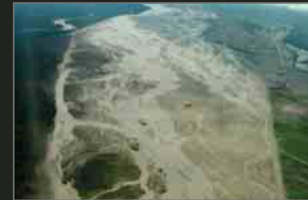
Environmental destruction: The river system downstream of the Freeport mine has been poisoned and silted and the Arafura Sea has been heavily polluted. Serious environmental damage is also occurring as a result of oil extraction by two of the world's largest oil companies, Petromer and Conoco, and uncontrolled logging is devastating massive tracts of pristine rainforest. BP are currently starting a multi-billion dollar gas extraction plant on the western coast which threatens further environmental damage.