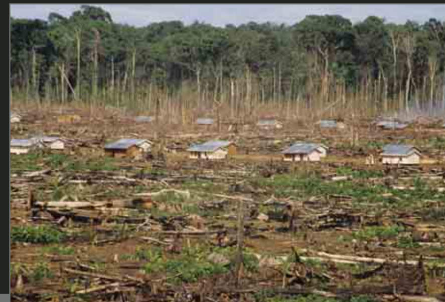
A transmigration camp under construction. Settlers from Java become the ethnic majority in this area.