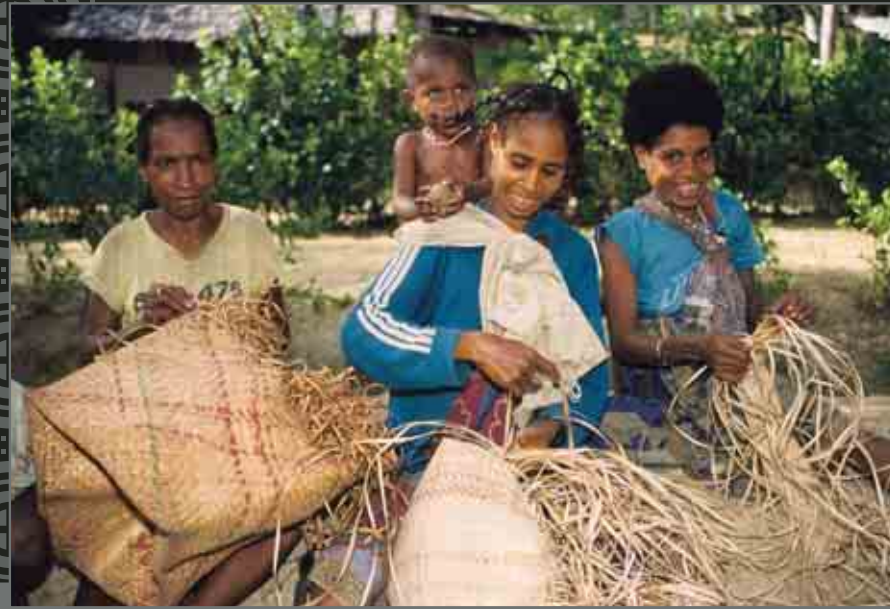
Moi women near Sorong. Femmes de la tribu Moi près de Sorong.