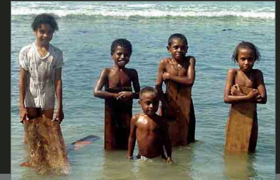
Coastal children, Biak Island. Many of the people of West Papua live in coastal areas like these children from the island of Biak just north of the mainland. Biak Island is considered a part of West Papua and is a strong centre of the independence movement.

Située à seulement 250 km de l'Australie, la Papouasie occidentale, ancienne colonie néerlandaise, occupe la moitié ouest de l'île de la Nouvelle-Guinée. Au cours des années 1950, reconnaissant le caractère distinct de la Papouasie occidentale par rapport au reste de l'Indonésie, le gouvernement hollandais met en place les conditions pour que sa colonie acquière son indépendance. En 1962, l'Indonésie envahit la Papouasie occidentale, engendrant un conflit avec les Pays-Bas. Les États-Unis interviennent alors et imposent une entente qui donne le contrôle de la colonie à l'Indonésie, en attendant que la population exprime son opinion par voie de référendum. En 1969, l'Indonésie organise un référendum frauduleux appelé l'Acte du libre choix. Seulement 1 025 Papous, sur une population comptant à l'époque 800 000 âmes, sont choisis pour voter. Sous la contrainte et soumises à une grave intimidation, ces personnes sont forcées de voter pour que la Papouasie occidentale demeure rattachée à l'Indonésie. Comble de la honte, l'ONU approuve les résultats du vote, et la Papouasie occidentale devient officiellement une province de l'Indonésie. Map/carte: Leslie Butt