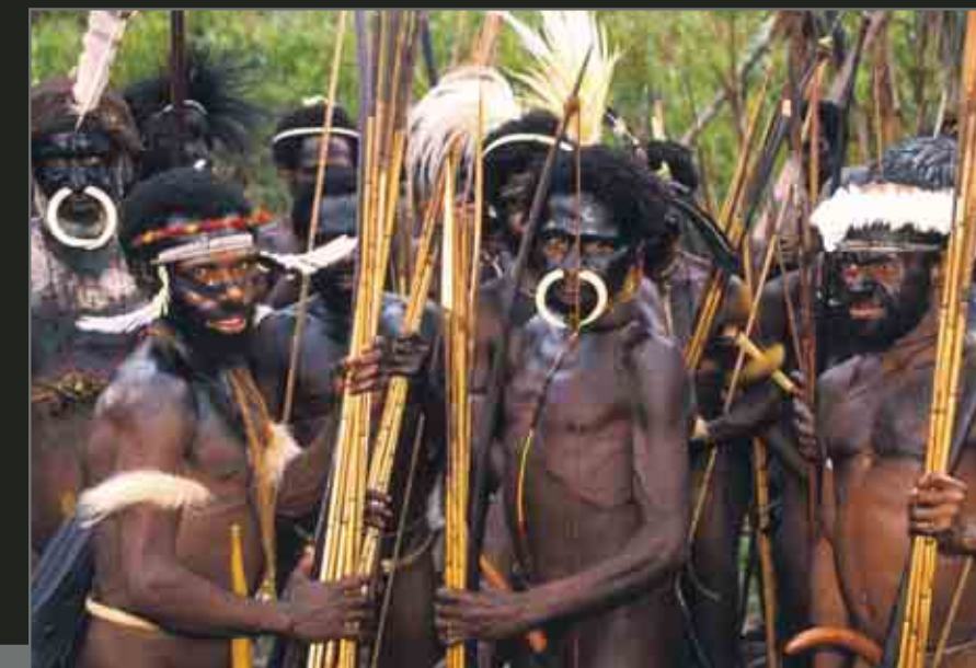
Baliem Valley, Dani men dressed in the traditional manner for tribal war. Vallée de Baliem. Hommes de la tribu Dani vêtus des habits traditionnels de guerre tribale.