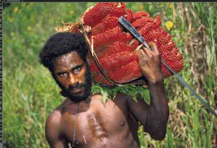
Baliem Valley, Man carrying buah mera ("red fruit"). Pandanus conoideus, traditionally used for both nourishment and medicinal purposes. Vallée de Baliem. Homme transportant des buah mera (« fruit rouge » ou Pandanus conoideus, traditionnellement utilisé à des fins alimentaires et médicinales).