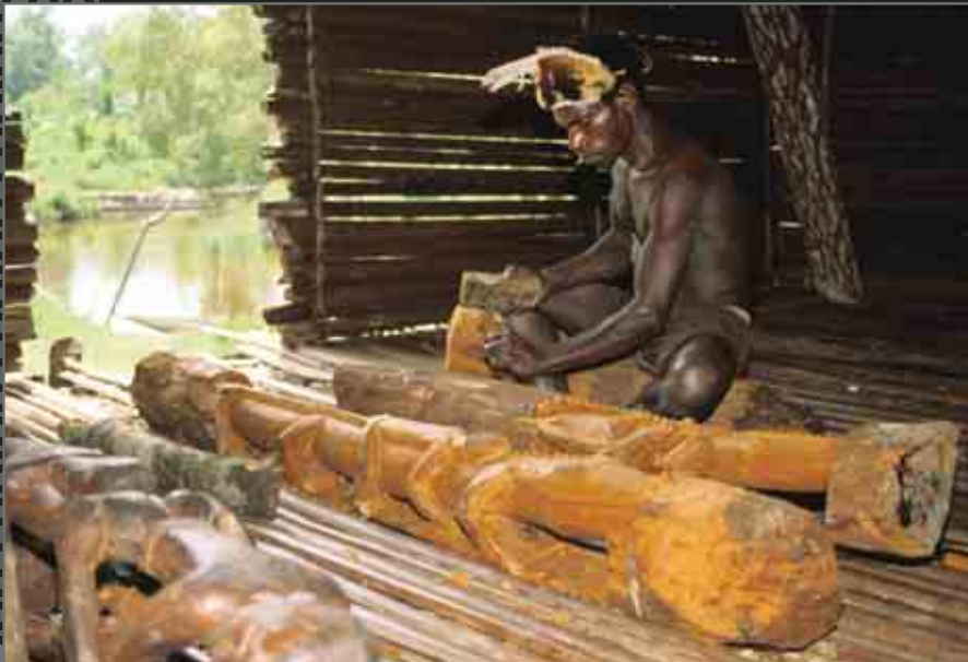
Asmat carver. Sculpteur de la tribu Asmat.