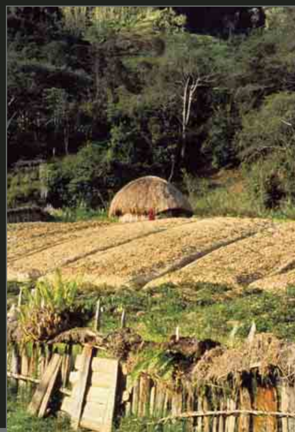
Baliem Valley, central highlands. Dani fields and hut. Vallée de Baliem, région montagneuse centrale. Champs et hutte de la tribu Dani.