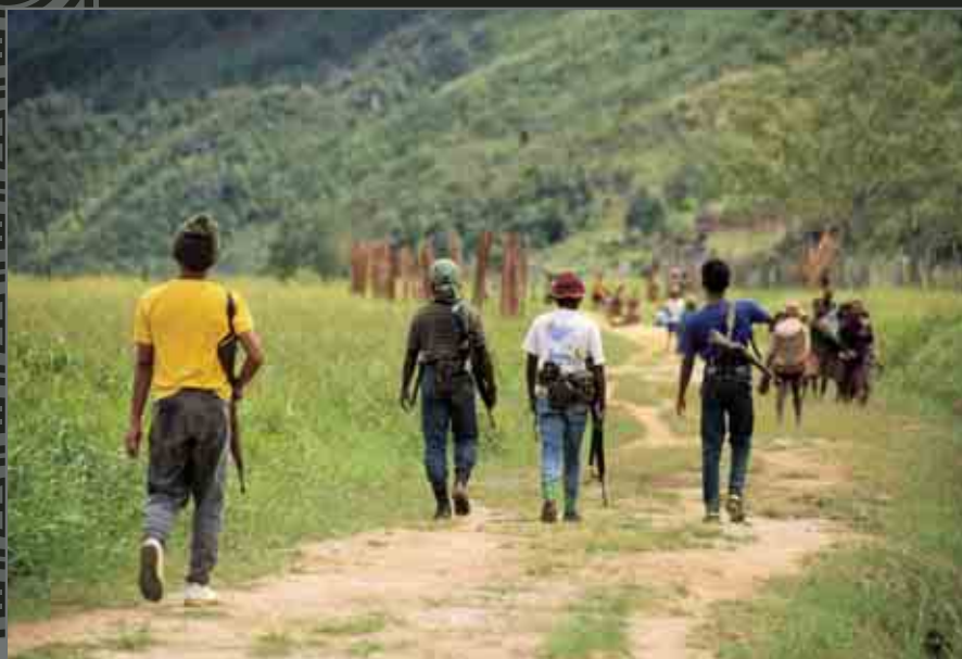
Indonesian soldiers on patrol near Enarotali, western highlands. Poor boys recruited mostly from other areas of Indonesia, they are given neither uniforms nor adequate pay or rations, and to feed themselves they must confiscate food from the local people.