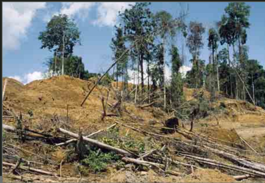
Logging destruction near Sorong. Destruction causée par la coupe de bois près de Sorong.