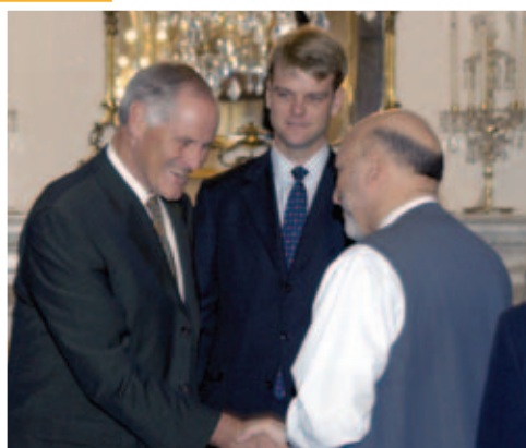
Engagement croissant — De gauche à droite : le ministre des Affaires étrangères Bill Graham et l'ambassadeur Christopher Alexander avec le président de l'Afghanistan, Hamid Karzai, au palais présidentiel de Kaboul

Pour plus de renseignements sur les relations diplomatiques du Canada avec l'Afghanistan : www.dfait-maeci.gc.ca/afghanistan