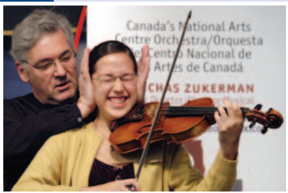
Cours de maître — Pinchas Zukerman enseigne en tournée à Monterrey, au Mexique.

À Monterrey, l'Orchestre a présenté des activités éducatives novatrices en faisant appel à la technologie de la vidéoconférence par Internet. Au Canada, aux États-Unis et au Mexique, des écoles ont été reliées au moyen du service Internet de la prochaine génération du CNA. Pendant la tournée, les membres de l'Orchestre ont aussi écrit des messages quotidiens dans un journal sur le très populaire site Web du CNA pour les jeunes ( www.artsvivants.ca ). 🍀