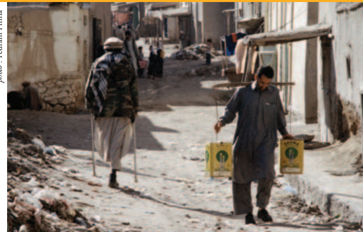
Rue de Kaboul — Il est essentiel de répondre aux besoins humanitaires et de reconstruction du peuple afghan.

du gouvernement. L'Agence canadienne de développement international (ACDI), par exemple, a fourni au ministère de la Défense nationale (MDN) une aide financière à la réalisation d'activités de coopération civile et militaire, comprenant la reconstruction du pont Deh-e Punbah et des projets