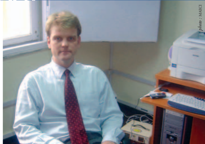
Des conditions modestes mais fonctionnelles — L'ambassadeur Christopher Alexander dans son bureau de Kaboul

Cette expérience est très utile à Kaboul, où son rôle consiste non seulement à supprimer les obstacles entre les Afghans, mais aussi à coordonner les nombreuses activités des Canadiens qui travaillent dans le pays. « Nos militaires se trouvent tout autour de nous, de dire M. Alexander, mais on trouve