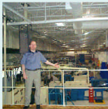
Tesma PFC, de North Sydney, est un fournisseur certifié QS-9000 de pièces pour l'industrie automobile.