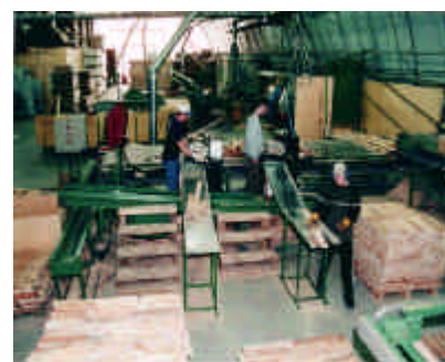
Forest Insight, le seul fabricant de parquets de bois dur préfinis au Canada atlantique, cible les marchés d'exportation.

Le Collège universitaire du Cap-Breton (UCCB) offre un ensemble innovateur de programmes menant à des baccalauréats, des diplômes et des certificats, combinant les sciences humaines et les sciences pures avec le génie, la technologie et les métiers traditionnels. Situé à proximité de Sydney, l'UCCB dessert environ 3 250 étudiants à temps plein et à temps partiel. L'institution