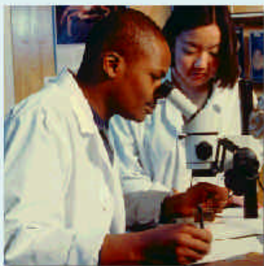
Le Collège universitaire du Cap-Breton et le Collège communautaire de la Nouvelle-Écosse jouent des rôles clés dans le soutien offert par le milieu de l'éducation.