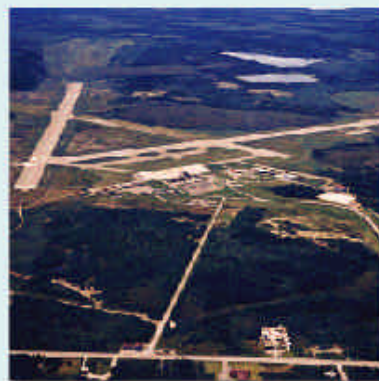
L'aéroport de Sydney est l'aéroport régional le plus développé au Canada.