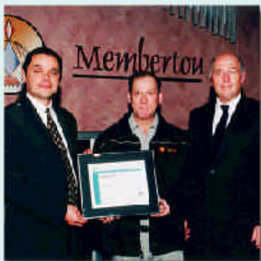
Les affaires, c'est chose sérieuse au Cap-Breton! La Première Nation de Membertou est le premier gouvernement autochtone au Canada à officiellement obtenir la certification ISO 9001.