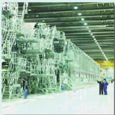
Stora Enso, une papetière qui s'est taillé un rôle de chef de file mondial, produit du papier journal et du papier satiné destinés aux marchés nord- américains.