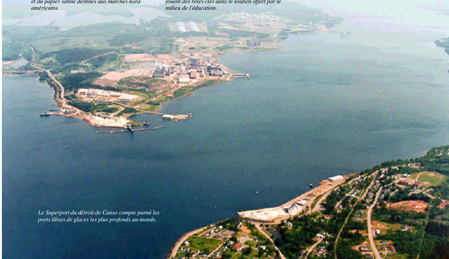
Le Superport du détroit de Canso compte parmi les ports libres de glaces les plus profonds au monde.