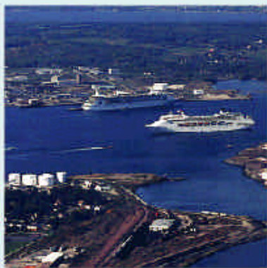
Le havre naturel de Sydney offre un accès aisé vers la Voie maritime du Saint-Laurent et les routes commerciales majeures à l'échelle mondiale.