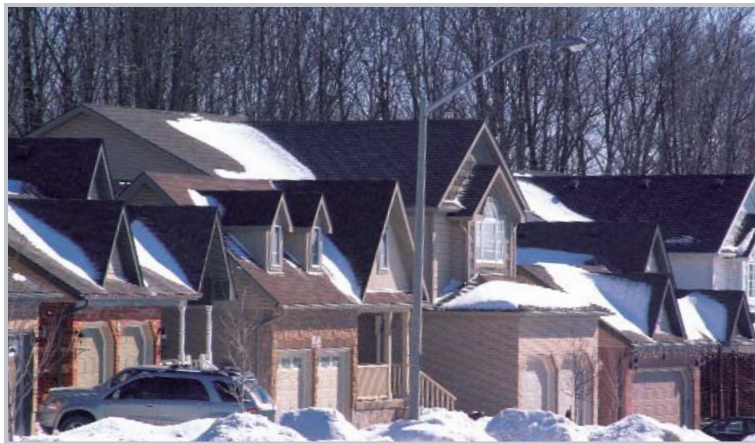
Forêt et zone urbaine

Certains agents stressants anthropiques sont propres aux zones urbaines ou grandement amplifiés dans ces zones. Ils peuvent avoir un impact sur presque tous les oiseaux forestiers jusqu'à un certain degré, mais l'effet sera souvent particulièrement prononcé sur les oiseaux forestiers sensibles à la superficie de l'habitat. Le tableau suivant présente les principaux agents de stress et leur importance relative estimée.