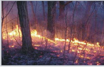
Feu de savane