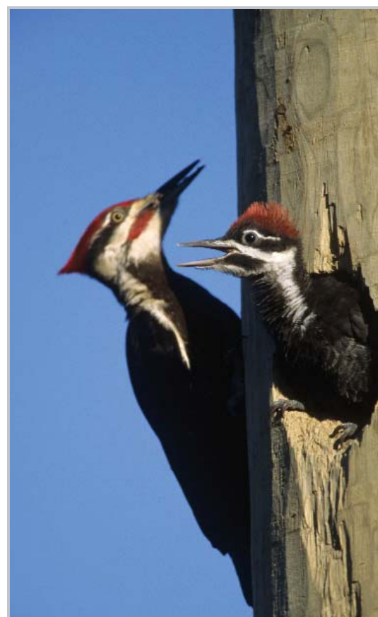
Grand Pic

Les zones de protection sont situées à l'extérieur des zones critiques afin de gérer l'intrusion des perturbations provenant de la matrice urbaine et influençant l'habitat forestier. Elles doivent être conçues de manière à ce que les effets de lisière soient gérés, ce qui peut nécessiter des mesures qui éviteront d'attirer un grand nombre d'espèces spécialistes de la lisière, comme les plantations denses de forêts simplement structurées. Des clôtures et autres barrières peuvent servir à limiter l'impact de la présence de personnes, du bruit, de la lumière, des eaux de ruissellement et même de certains animaux de compagnie.