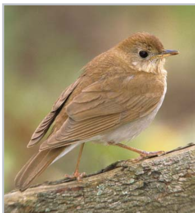
Grive fauve – espèce sensible à la superficie de l'habitat

Intégrer des espaces verts à l'environnement urbain peut faire toute la différence entre les fragments plus ou moins critiques. Il a été démontré que le couvert forestier en zone urbaine augmentait les populations d'au moins certains oiseaux forestiers à l'intérieur des régions boisées adjacentes.