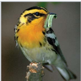
Paruline à gorge orangée / Eric Dresser

Les forêts urbaines fournissent nourriture et abri à divers groupes d'oiseaux, de mammifères, de poissons et d'autres vertébrés; elles apportent ombre et fraîcheur aux cours d'eau, atténuent le bruit et absorbent la poussière. La qualité de l'air se trouve améliorée grâce aux arbres qui produisent de l'oxygène tout en absorbant la pollution et en fixant le gaz carbonique. Les arbres font économiser l'énergie en atténuant indirectement les effets du climat : ils assurent un refroidissement par évaporation et protègent du vent et du soleil. Ces écoservices réduisent notre dépendance à l'égard de la production d'énergie. Les forêts urbaines améliorent l'eau en qualité et en quantité, car elles aident à maîtriser le ruissellement d'orage, à atténuer les pointes de débit et à maintenir un débit de base, à contrer l'érosion des sols et à intercepter les précipitations. Par ailleurs, il ne faut pas oublier les bienfaits essentiels qu'apportent les arbres à la santé physique, mentale et sociale des humains.