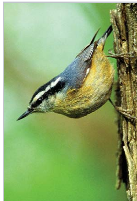
Sittelle à poitrine rouge / Walter B. Fechner

Les lignes directrices relatives à la configuration de la forêt et aux liens physiques auront une plus grande importance lorsque d'autres conditions, comme le couvert forestier total, diminuent. Par exemple, la configuration cesse d'être un facteur significatif pour le Tangara écarlate dans les zones dont le couvert forestier est d'au moins 70 %.