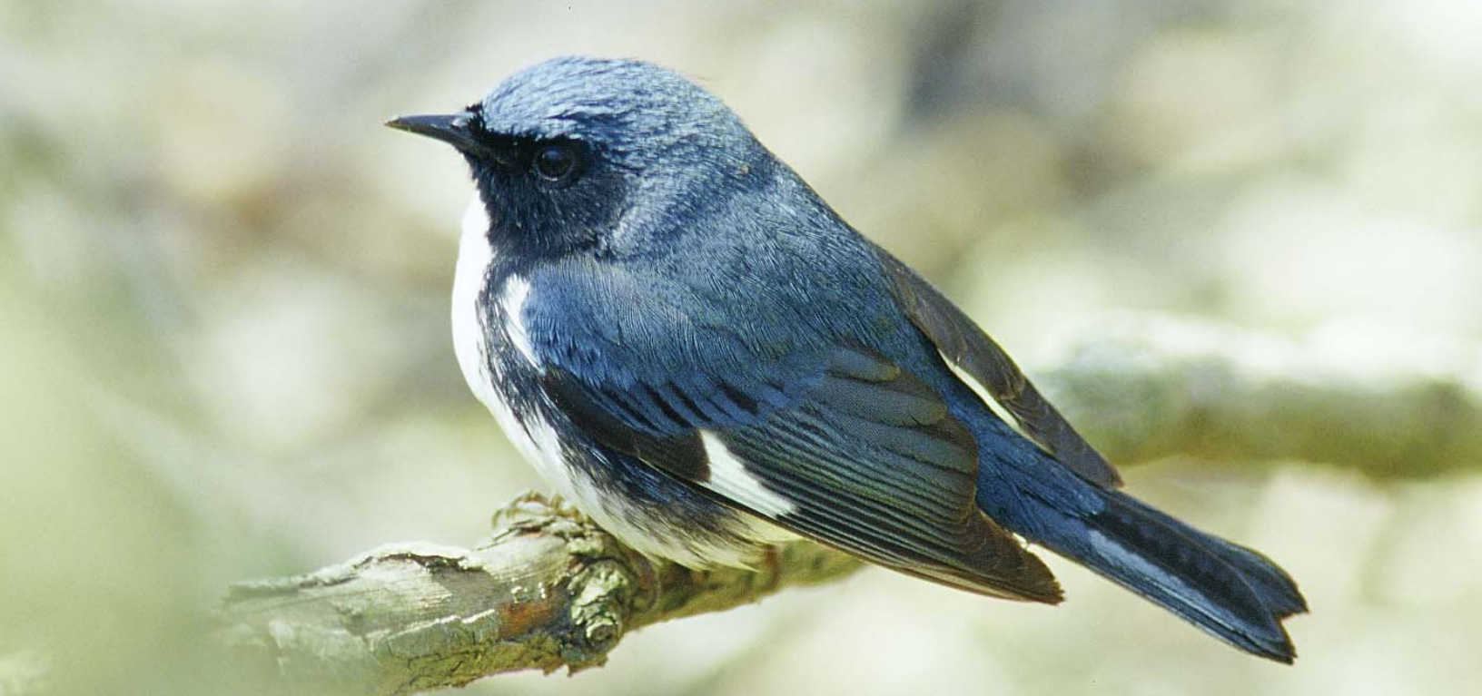
Paruline bleue / Walter B. Fechner