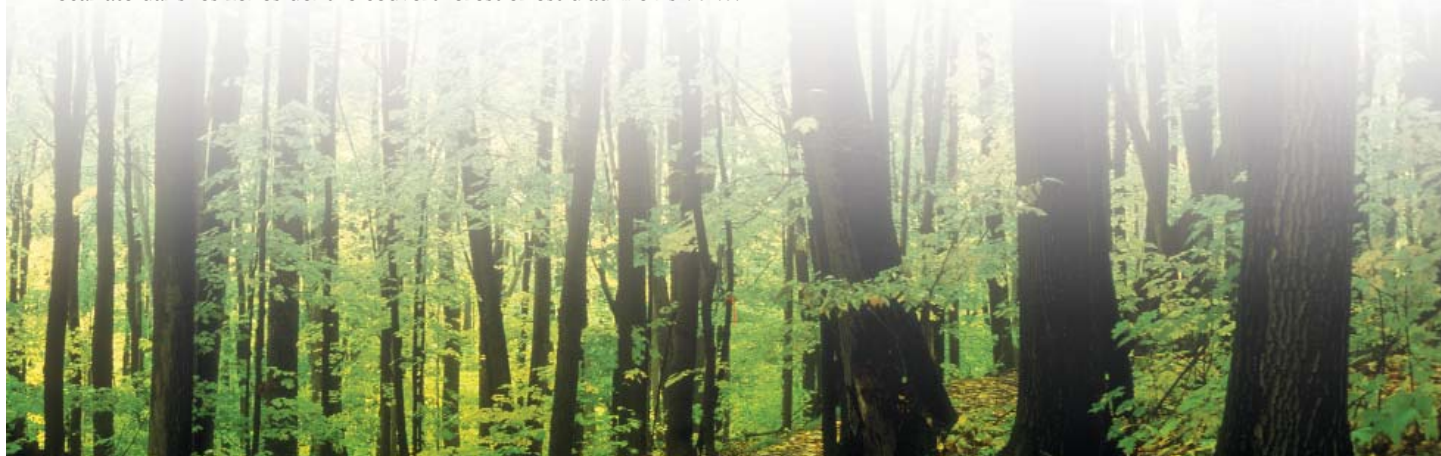
Forêt de feuillus à l'automne / James Sidney