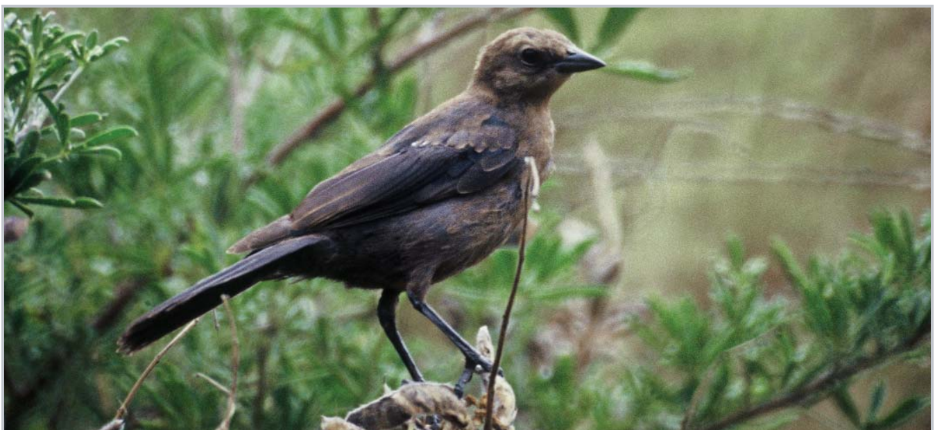
Vacher à tête brune

La simple proximité de constructions humaines telles que des complexes résidentiels peut être un facteur essentiel, mais insuffisamment étudié, du déclin des oiseaux forestiers. L'absence d'autres membres de la même espèce peut également influencer l'utilisation d'un îlot boisé donné.