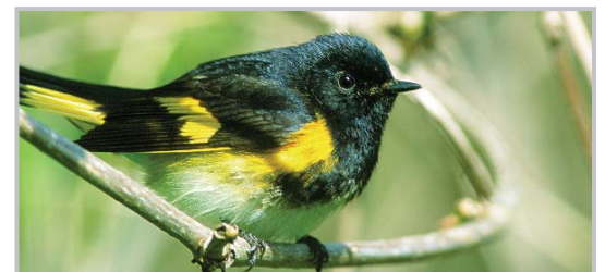
Paruline flamboyante

L'évolution irréversible de l'utilisation des sols associée à l'urbanisation peut exiger d'élaborer de nouveaux objectifs concernant la prestation des écoservices en zone urbaine. La dette des services perdus ou diminués – habitats de reproduction viables pour les oiseaux forestiers sensibles à la superficie de l'habitat, diversité des gènes, des espèces animales et des communautés, pollinisation et fixation du gaz carbonique – doit être reconnue et compensée par le maintien et le renforcement des mêmes services ailleurs, dans les zones non urbanisées du bassin hydrographique.