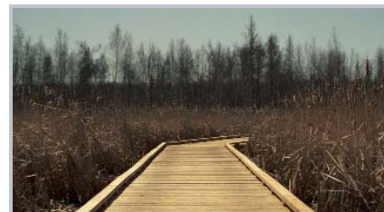
Promenade de bois

L'utilisation par les humains de zones naturelles, même dans le cadre d'activités « passives » telles que la marche sur des sentiers naturels, a un impact sur la faune (voir la section intitulée « Perturbations directes et sentiers »). Cela est particulièrement manifeste dans les zones urbaines où de telles utilisations sont relativement intenses. Les perturbations causées par les humains sont habituellement incompatibles avec une utilisation optimale de la forêt par la faune. La conception minutieuse des sentiers, le recours à des techniques visant à délimiter le flux piétonnier dans certains endroits et l'identification ainsi que le clôturage des zones d'exclusion devraient tous être envisagés.