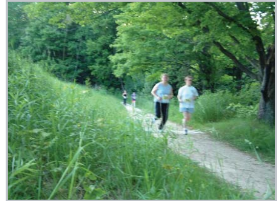
Utilisation des sentiers

Globalement, il semble que les perturbations directes, résultant d'activités comme la marche ou le cyclisme sur les sentiers ou en dehors de ceux-ci, peuvent être préjudiciables à toutes les espèces, à l'exception de quelques-unes très tolérantes : ces perturbations peuvent être telles qu'elles contribuent, dans certaines zones de forêts urbaines, à la disparition pure et simple de certaines espèces.