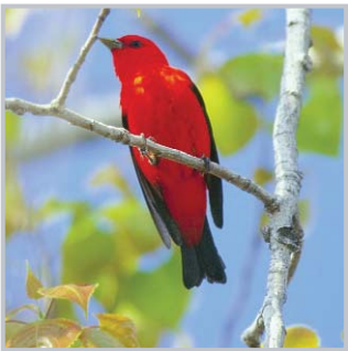
Tangara écarlate / Walter B. Fechner

La fiche d'information s'inspire du rapport du Service canadien de la faune intitulé Oiseaux forestiers sensibles à la superficie de l'habitat en zone urbaine (Ontario, 2006).