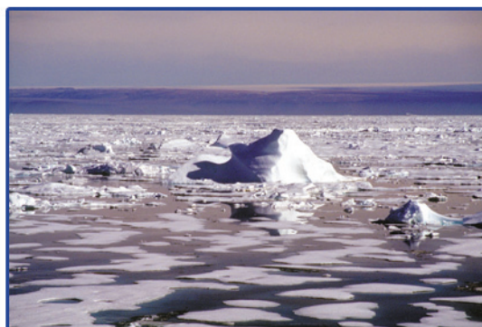
Photo 4.2 : Fragment d'iceberg et restant de crête emprisonnés dans de la glace pourrie de première année.