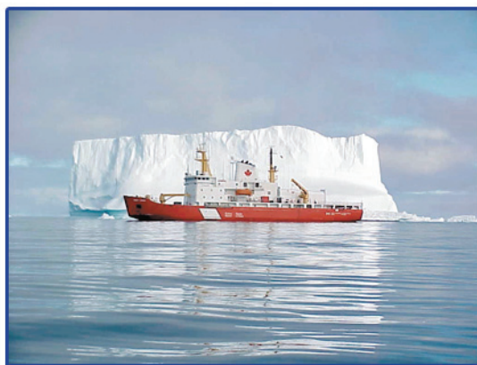
Photo 4.1 : Le brise-glace Henry Larsen de la GCC voguant près d'un très grand iceberg tabulaire.