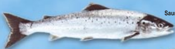
Saumon de l'Atlantique/Ouaniche