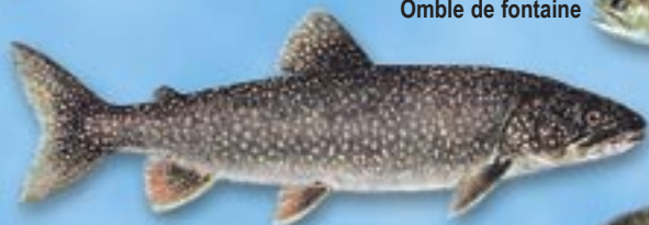
Omble de fontaine