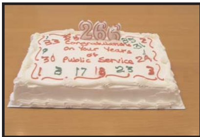
Le "266" indique le nombre total d'années tenu par les employés du CNPA au sein de la fonction publique

Au CNPA, nous reconnaissons que la diversité transcende les différences ethniques ou culturelles. Nous savons qu'elle englobe tous les facteurs, internes et externes qui font de chacun de nous un être distinct et unique!