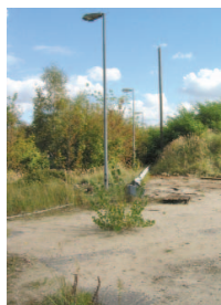
Die in Malaysia geborene Künstlerin beschäftigt sich mit der Bedeutung von Alltagshandlungen und -objekten sowie Kreisläufen von Geld, Waren und Arbeit. In ihrer neuen Arbeit verwendet sie Materialien

wie Kopfsteinpflaster oder Unkraut, die sie aus ihren typischen urbanen Räumen löst.