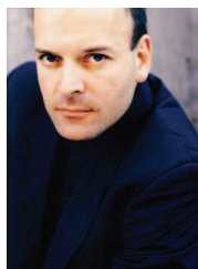
Foto: Im August wird Louis Lortie beim Moritzburg Festival im Klavierquartett g-moll KV 478 von Mozart und im Forellenquintett von Schubert zu hören sein. Am 17. und 18. September konzertiert er mit dem Berliner Symphonie Orchester im Berliner Konzerthaus. Am 21. und 22. September interpretiert Lortie im Rahmen des Bonner Beethoven Festivals die Klaviersonaten von Ludwig van Beethoven. 🍁