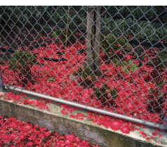
Foto: Stephen Waddell: Bougainvillea, 2004, colour photograph, 123x149cm

Werke von Germaine Koh und Stephen Waddell sind während des Art Forum Berlin in der von Susanne Titz kuratierten Sonderausstellung „Temporary Import – DAAD, Bethanien et. al.“ zu sehen. Die Sonderschau versammelt Künstler, die seit den 1960er Jahren in Berlin zu Gast waren oder es noch sind.