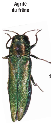
Agrile du frêne

L'agrile du frêne s'attaque aux frênes. Le comté d'Essex et la municipalité de Chatham-Kent en Ontario sont sous le coup d'une ordonnance visant à empêcher la propagation de l'insecte.