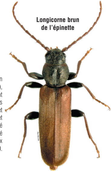
Longicorne brun de l'épinette

Le longicorne brun de l'épinette (LBE), qui est actuellement la cible de mesures d'éradication, attaque et tue les épinettes. Cet insecte est réglementé dans la municipalité régionale de Halifax depuis 2000.