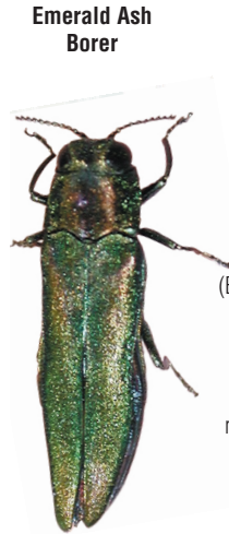
Emerald Ash Borer

The Emerald Ash Borer (EAB) attacks ash trees. Essex County and the Municipality of Chatham-Kent in Ontario are regulated to prevent its spread.