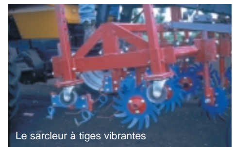
Le sarclateur à tiges vibrantes

Le sarclateur à tiges vibrantes comprend deux unités : des disques dentés et des tiges. Il est relativement agressif et peut par conséquent être utilisé autant en sol organique que minéral. Selon l'angle qu'on donne aux disques, ils produisent un dégagement du sol près du rang vers l'entre-rang ou un rehaussement sur le rang tout en déracinant les mauvaises herbes sur son passage. Les tiges vibrantes sont des paires de dents rigides, situées face à face, de chaque côté du rang; elles sont légèrement décalées pour éviter de briser la culture tout en passant le