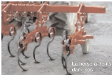
La herse à dents danoises

La herse à dents danoises est un sarcler agressif dont chaque dent a la forme d'un "S" terminé par un soc triangulaire. Ses dents aèrent le sol en profondeur en creusant des sillons