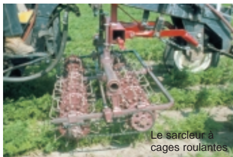
Le sarcler à cages roulantes

Ce sarcler contient deux séries de cages, chacune pivotant autour d'un essieu; la première série de cages au diamètre plus grand tourne moins vite que la deuxième série. Ces cages sont fabriquées en différentes largeurs et peuvent être disposées le long de l'essieu selon la largeur à biner entre les rangs. Les ajustements sur ce sarcler sont rapides à faire puisqu'il ne s'agit que de choisir la bonne largeur des cages et de les glisser le long de l'essieu. Il peut être employé en sol minéral comme en sol organique et travaille à une profondeur de 3 à 7 cm. Pour compléter son désherbage, il requiert entre 3 et 5 passages tout au long de la saison.