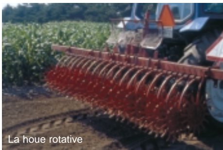
La houe rotative

Le principe d'une houe rotative ne repose que sur le roulement des disques surplombés de dents pointues, alignés les uns après les autres. Ce sarcler s'emploie uniquement en sol minéral et a l'avantage d'être vite passé en plus d'effectuer un binage non-sélectif en pré-émergence. De faibles dommages à la culture peuvent toutefois être observés immédiatement après son passage en post-émergence mais la culture reprend vite sa forme. La houe rotative ne peut pas être utilisée lorsque la culture est sensible aux dommages. La houe rotative brise la croûte qui se forme à la surface du sol et permet ainsi une meilleure aération du sol. Elle déracine les germes de mauvaises herbes et travaille à une profondeur de 5 cm. Sa régie de désherbage requiert 3 passages.